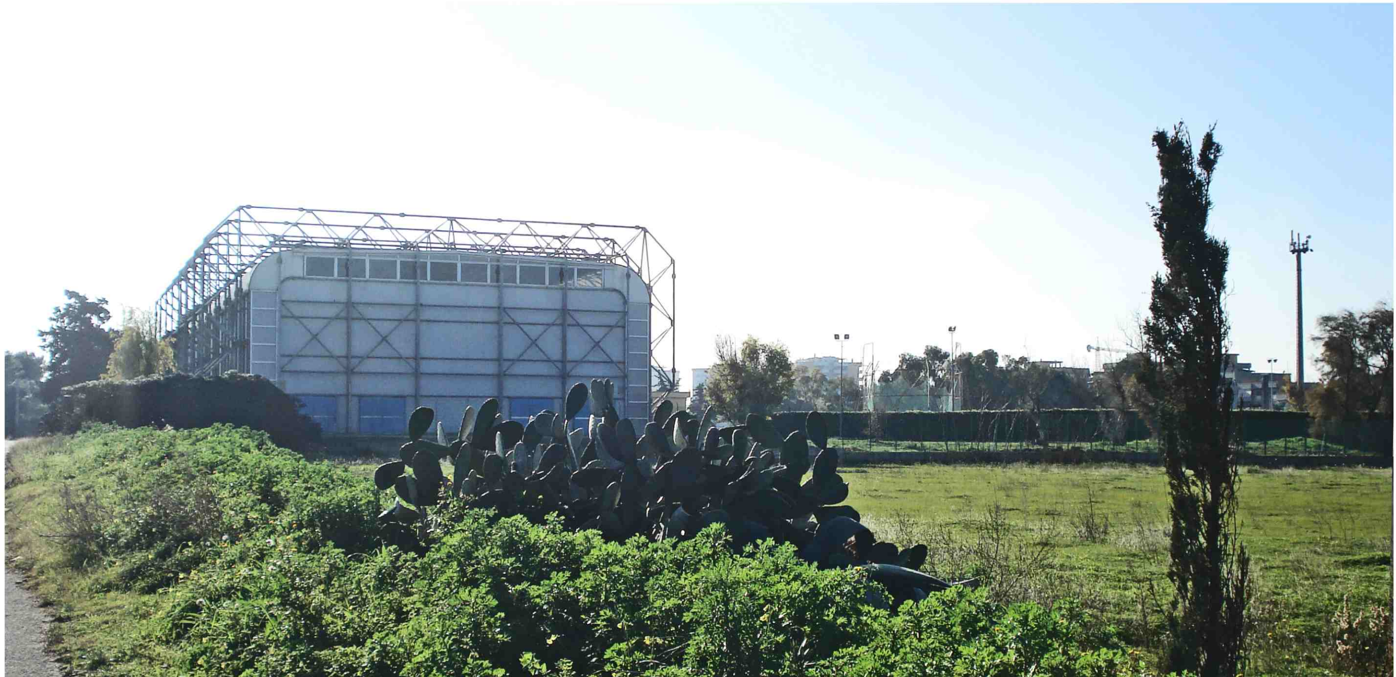
PUNTO DI RIPRESA FOTOGRAFICA 6