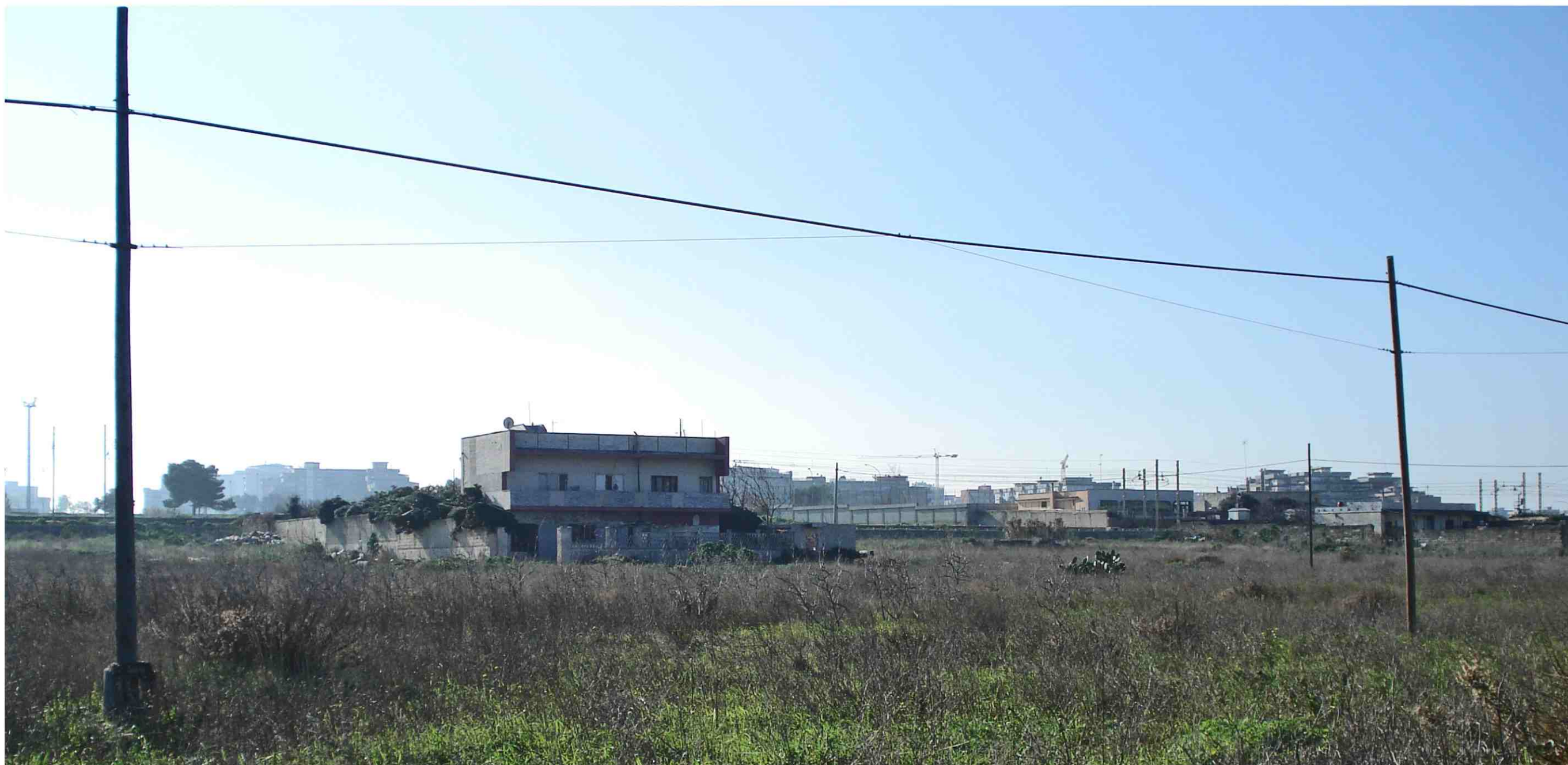
PUNTO DI RIPRESA FOTOGRAFICA 3