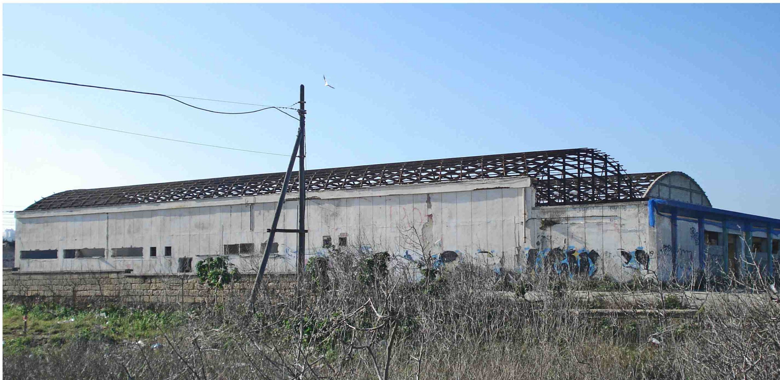
PUNTO DI RIPRESA FOTOGRAFICA 2