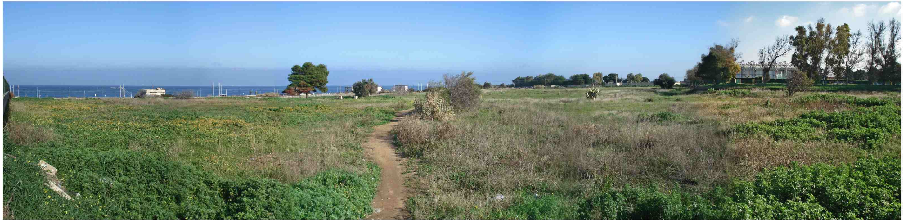
PUNTO DI RIPRESA FOTOGRAFICA 5