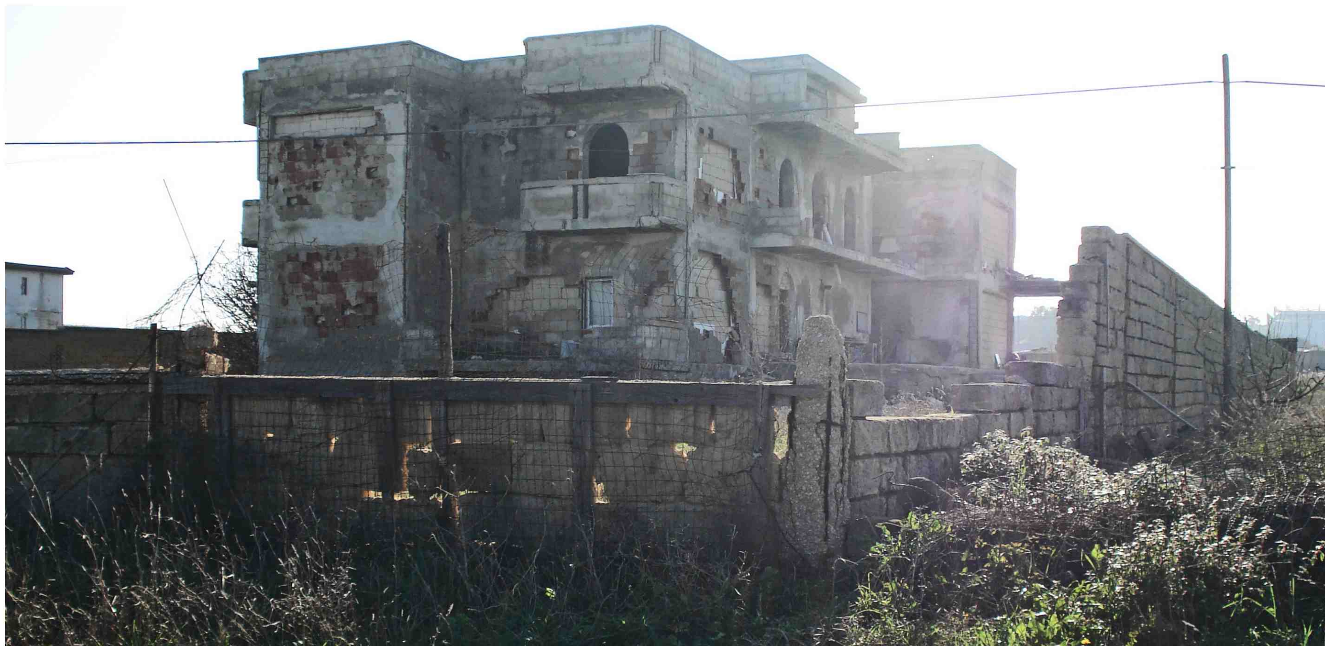
PUNTO DI RIPRESA FOTOGRAFICA 4