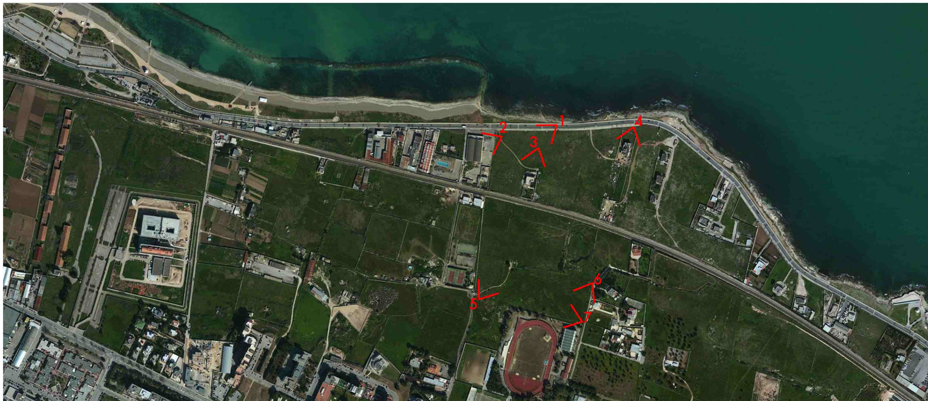
VISTA SATELLITARE - STATO DI FATTO