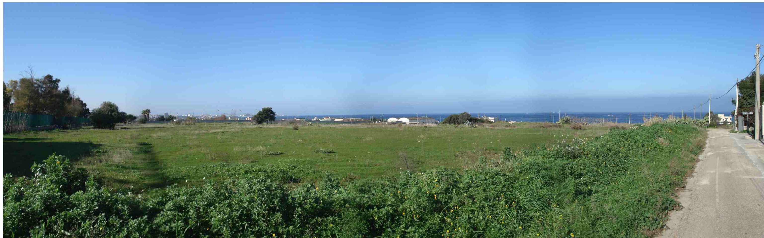
PUNTO DI RIPRESA FOTOGRAFICA 7