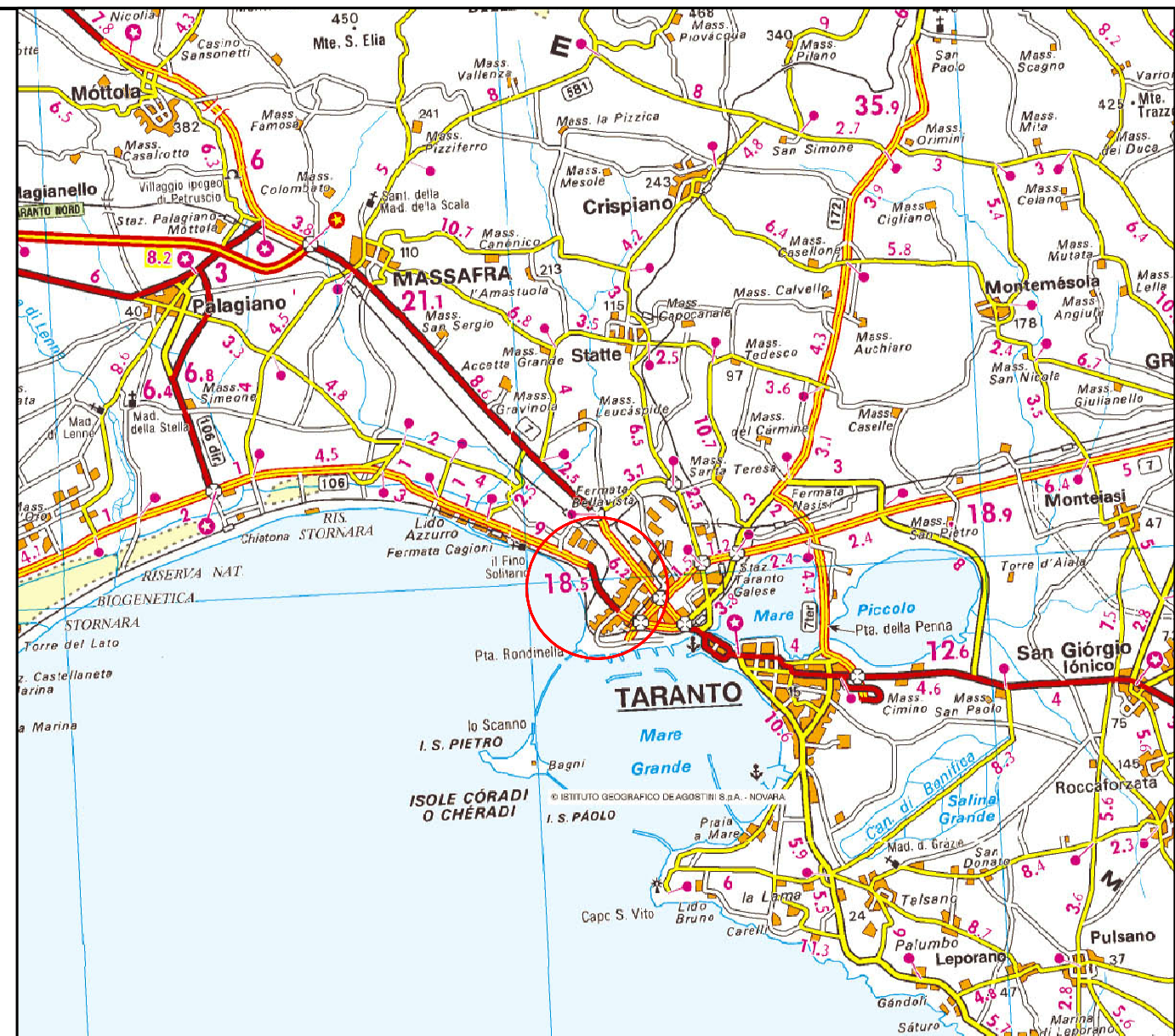
COROGRAFIA Scala 1:200.000