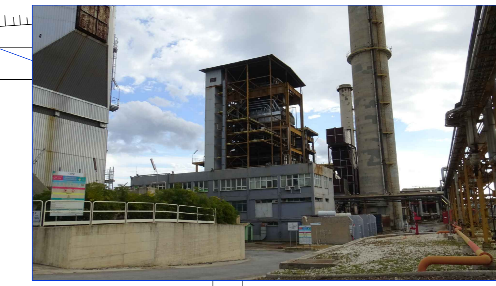
VISTA GENERALE FRONTE NORD DA STRADA "9/3" SITO MULTISOCIETARIO