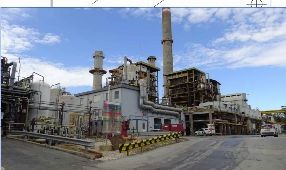
VISTA GENERALE FRONTE SUD-EST DA STRADA INTERNA SA1N