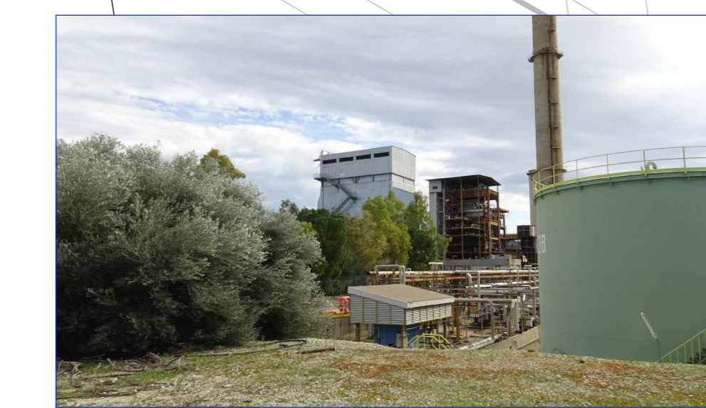
VISTA GENERALE FRONTE NORD-OVEST DA STRADA "N/1" SITO MULTISOCIETARIO