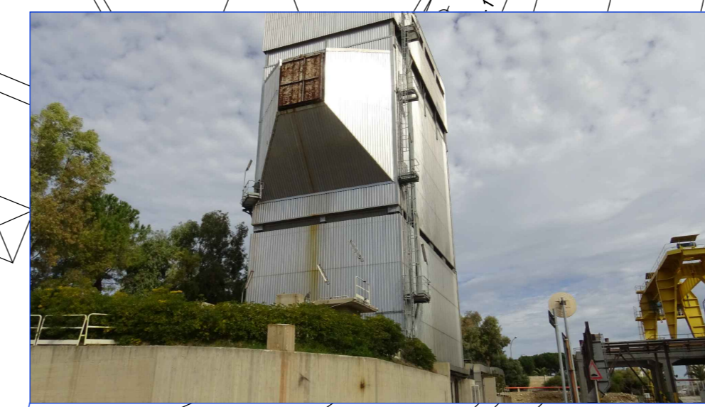
VISTA APPARECCHIATURE DA SMANTELLARE (ELETTROFILTRO) FRONTE OVEST