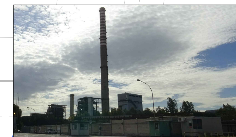
VISTA GENERALE FRONTE NORD-EST DA STRADA "N" SITO MULTISOCIETARIO