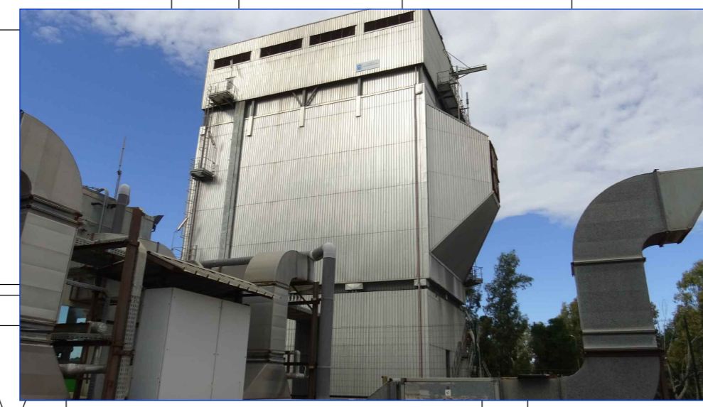
VISTA APPARECCHIATURA DA SMANTELLARE (ELETTROFILTRO) FRONTE SUD DA PIANO IN QUOTA SA1N