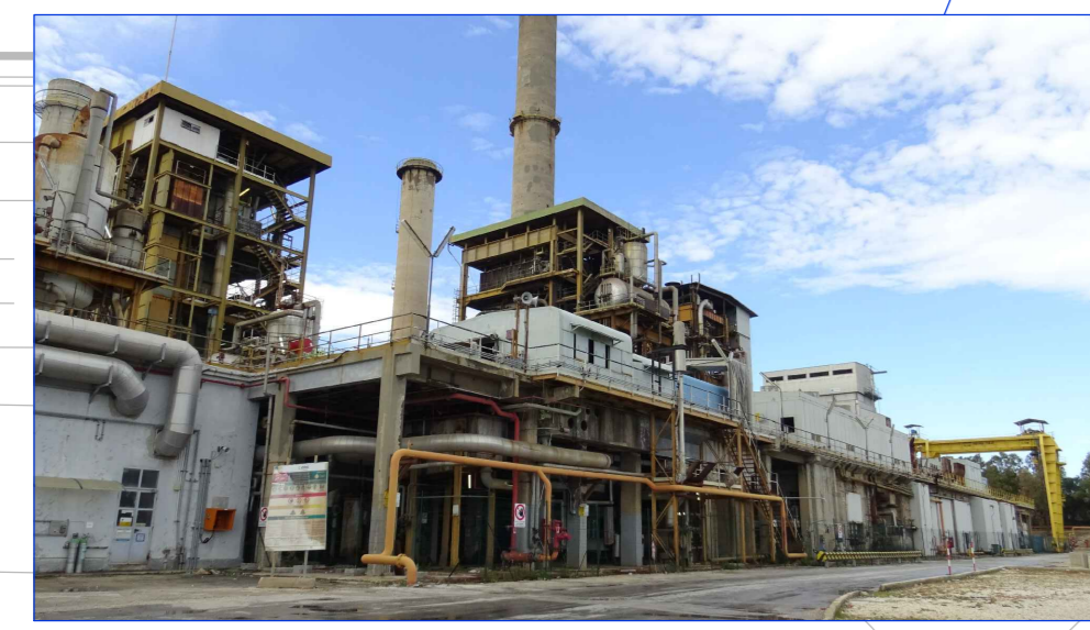
VISTA GENERALE FRONTE EST DA STRADA INTERNA SA1N