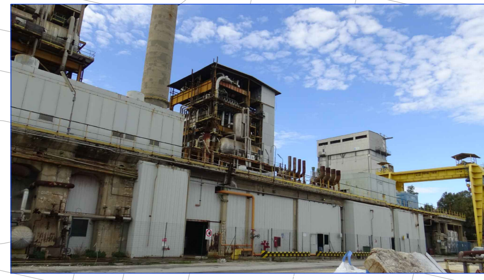
VISTA APPARECCHIATURE DA SMANTELLARE FRONTE EST DA STRADA INTERNA SA1N