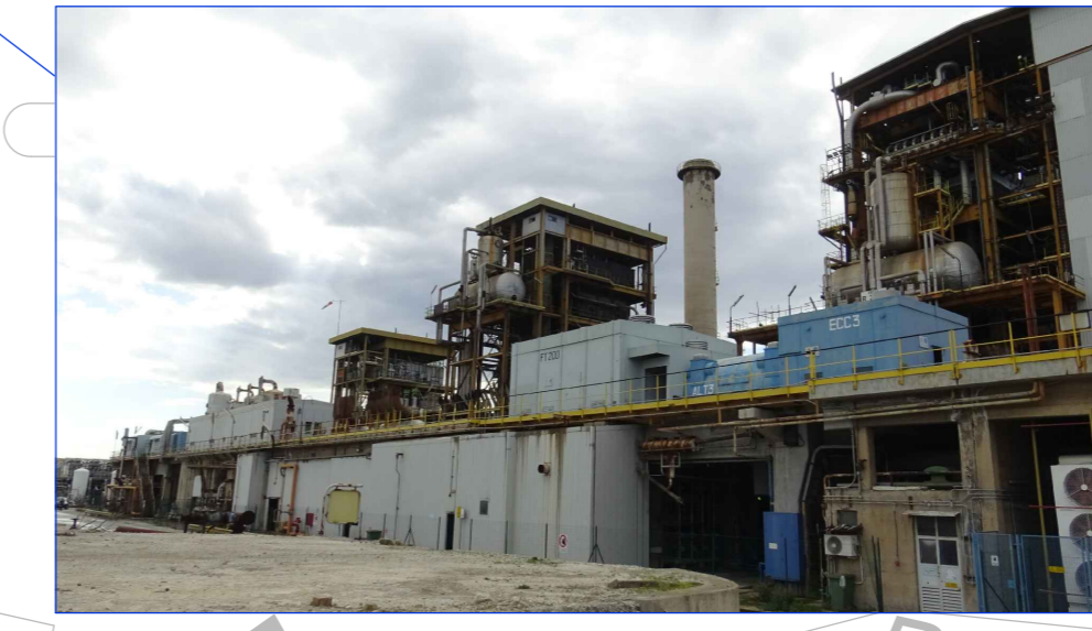
VISTA APPARECCHIATURE DA SMANTELLARE FRONTE NORD-EST (TURBINA, ALTERNATORE, POMPE) DA STRADA INTERNA SA1N