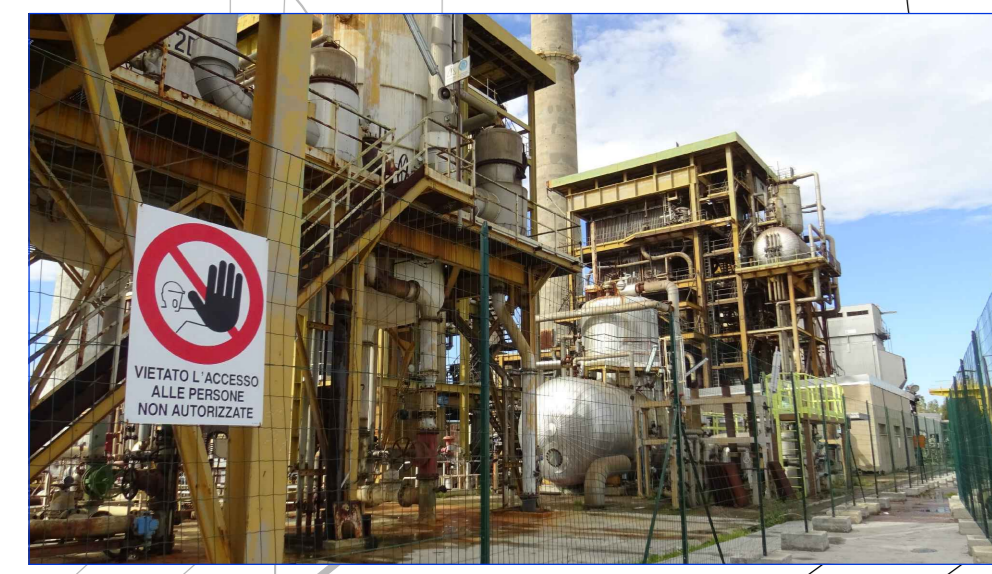
VISTA FRONTE SUD DA PIANO IN QUOTA SA1N