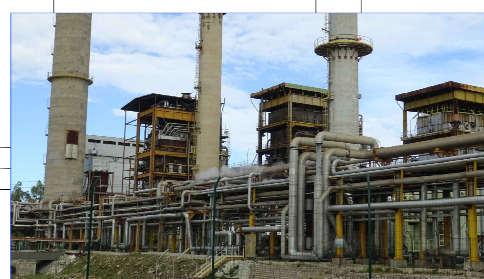
VISTA GENERALE FRONTE OVEST DA STRADA LIMITROFA A SOTTOSTAZIONE II SA2