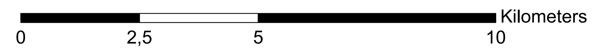
Quadro d'unione - scala 1:500.000