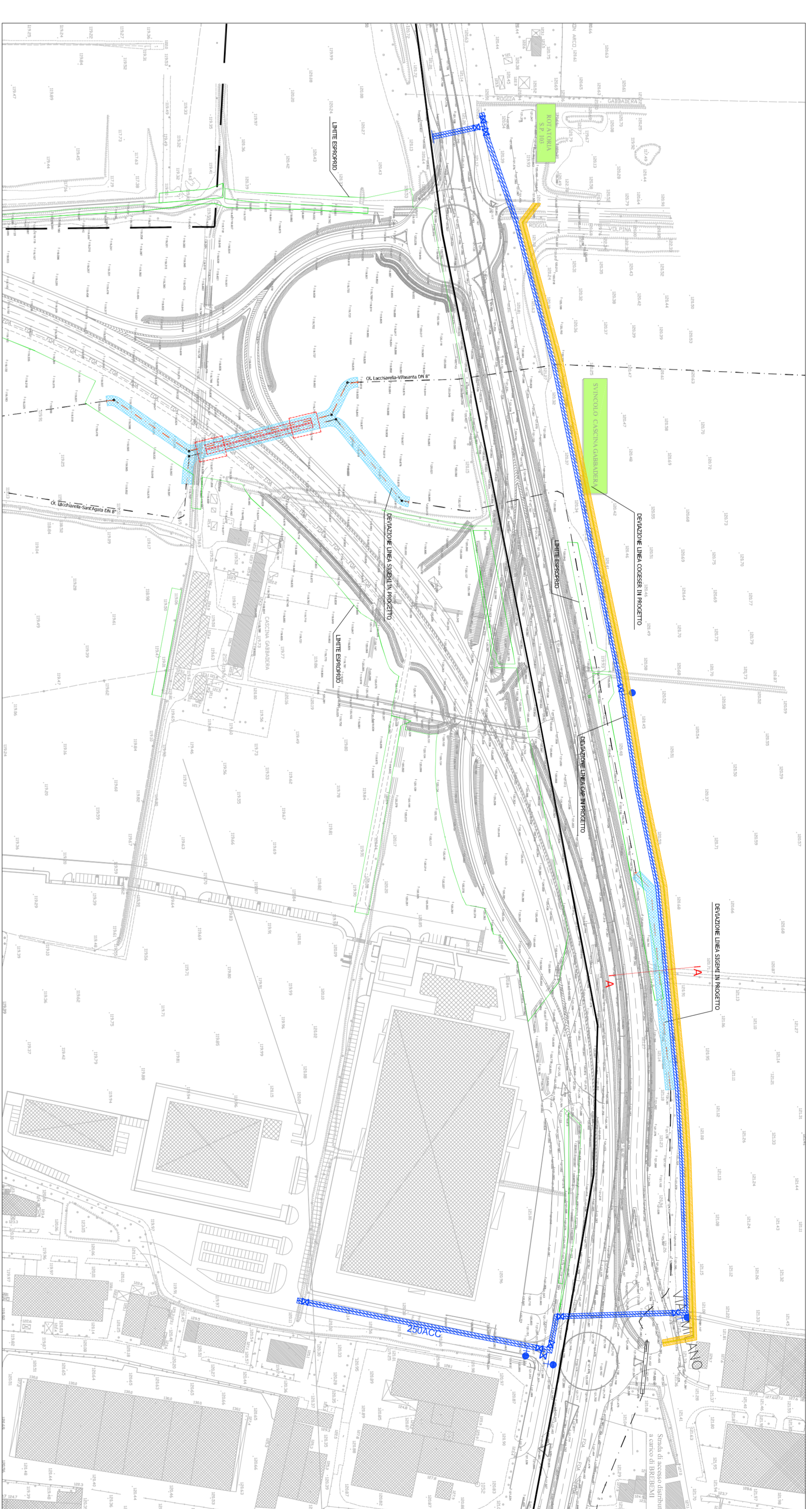
PLANIMETRIA DEVIAZIONI CAP E FASCE DI RISPETTO scala 1:2000