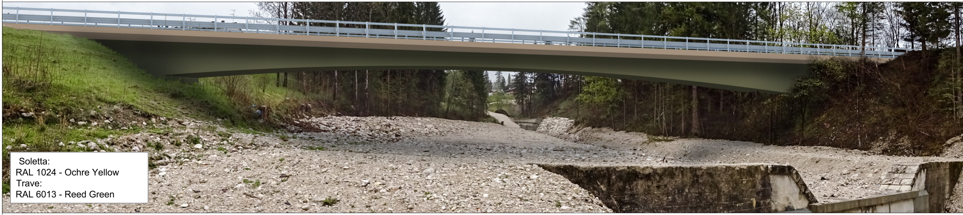
Soletta: RAL 1024 - Ochre Yellow Trave: RAL 6013 - Reed Green