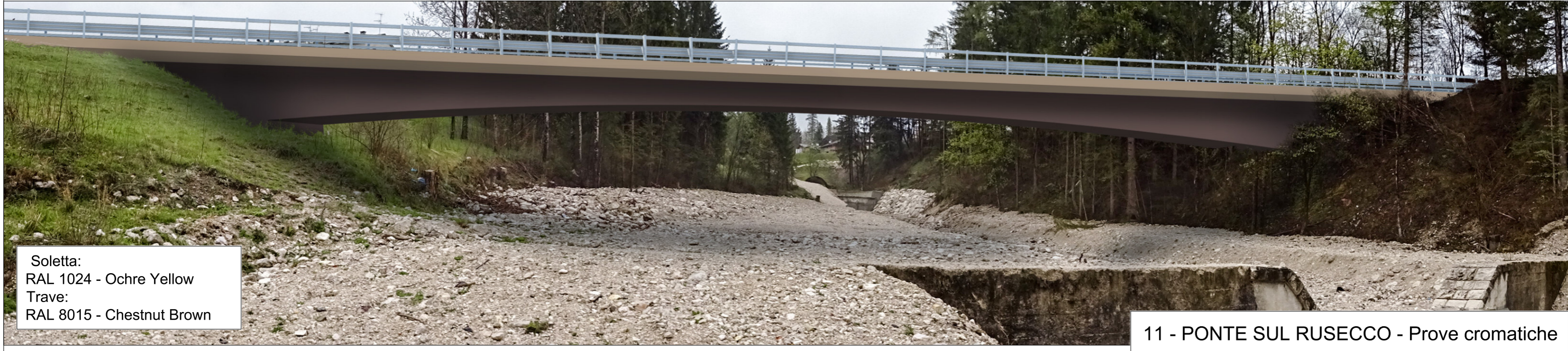
Soletta: RAL 1024 - Ochre Yellow Trave: RAL 8015 - Chestnut Brown