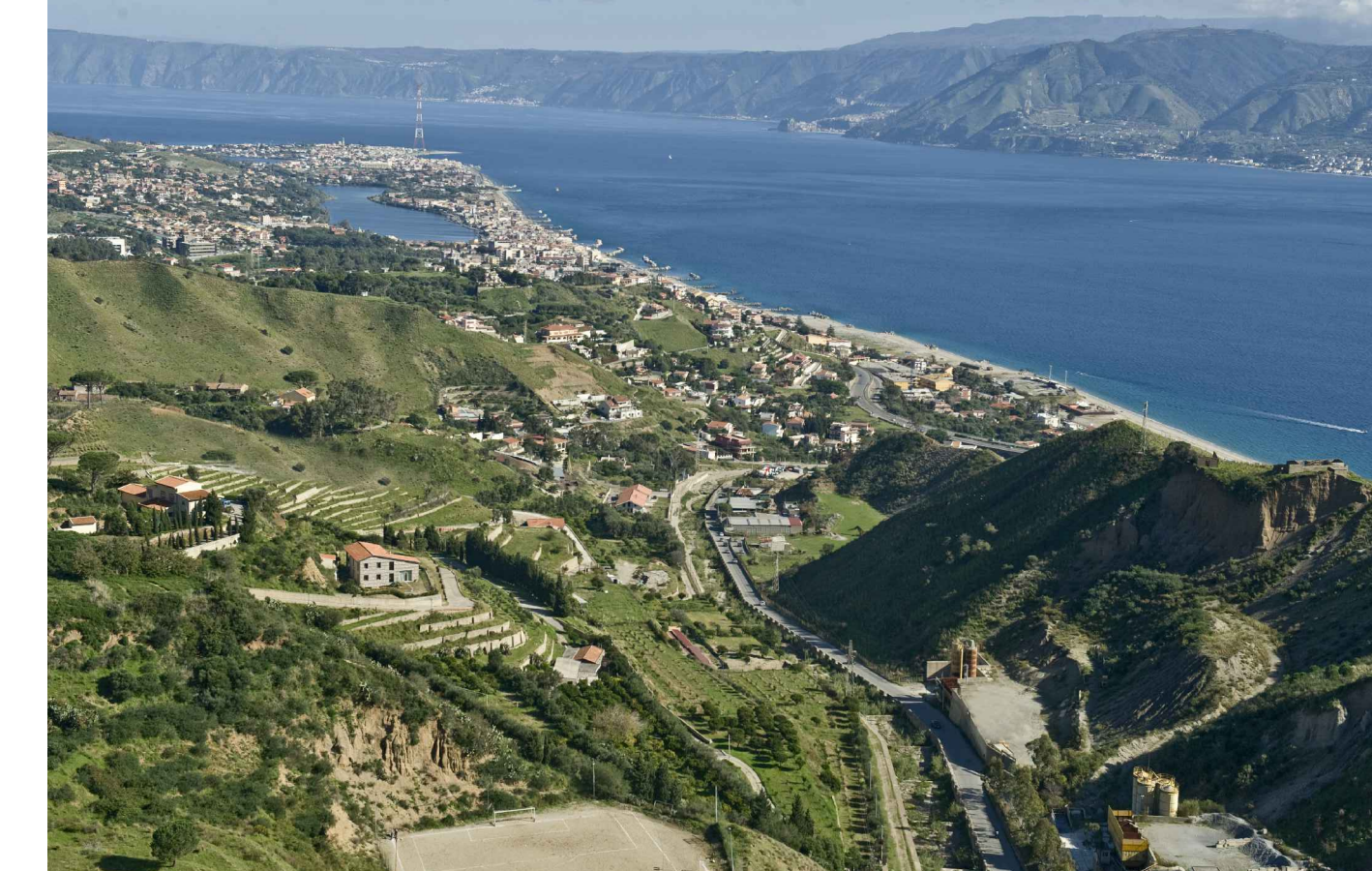
FOTOINSENERIMENTO - SISTEMAZIONE FINALE DELL'AREA DI CANTIERE