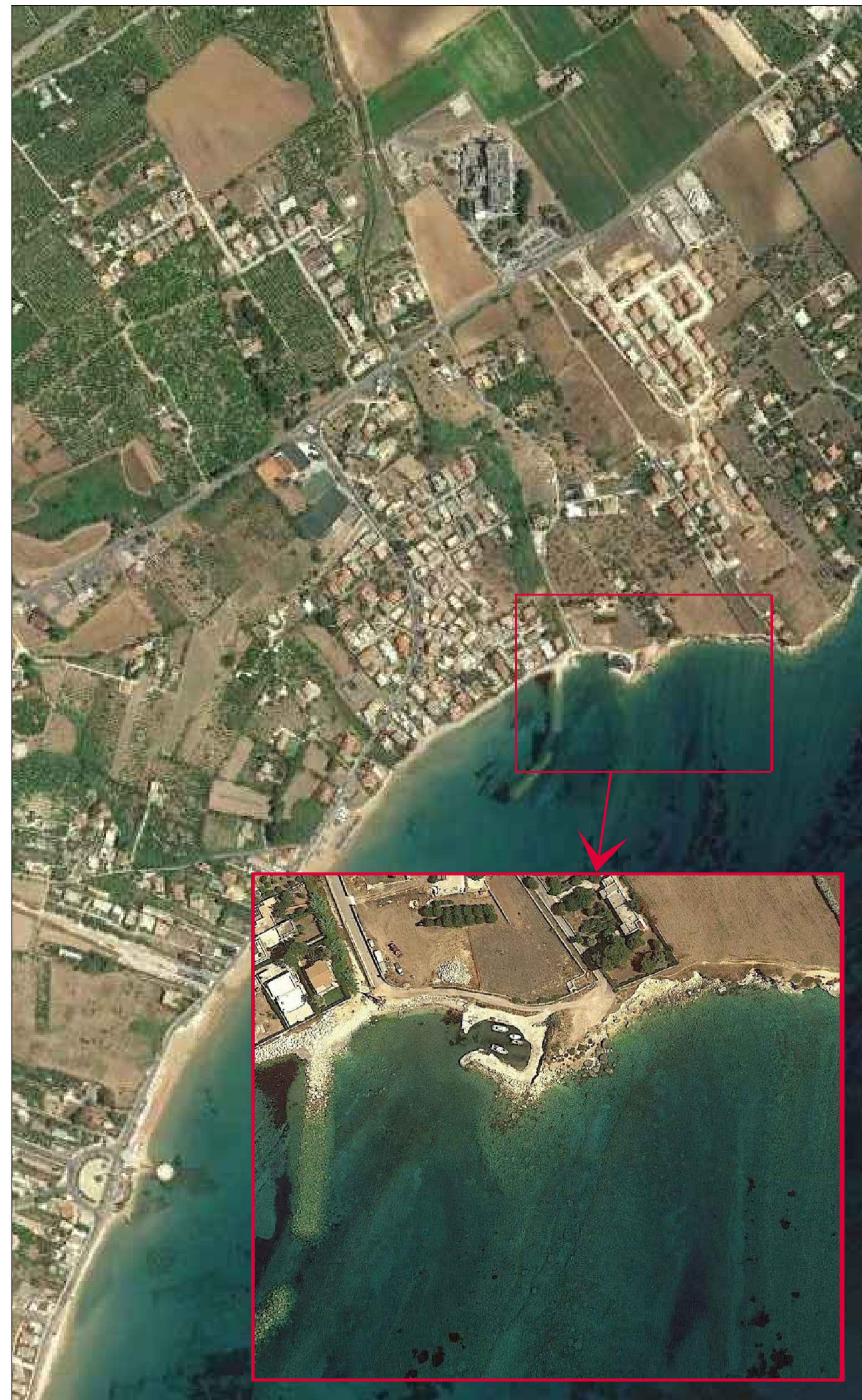
Ortofoto satellitare con individuazione area di intervento - Scala 1:10.000