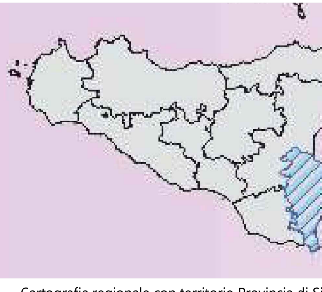
Cartografia regionale con territorio Provincia di Siracusa