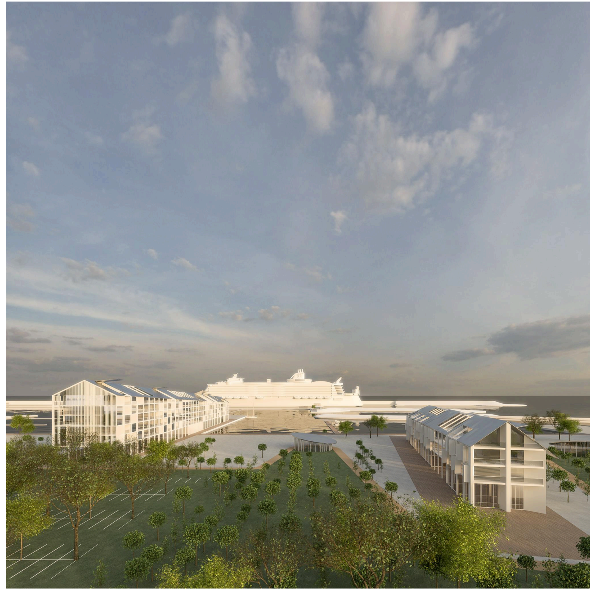
1_Real estate area: l'hotel e le residenze