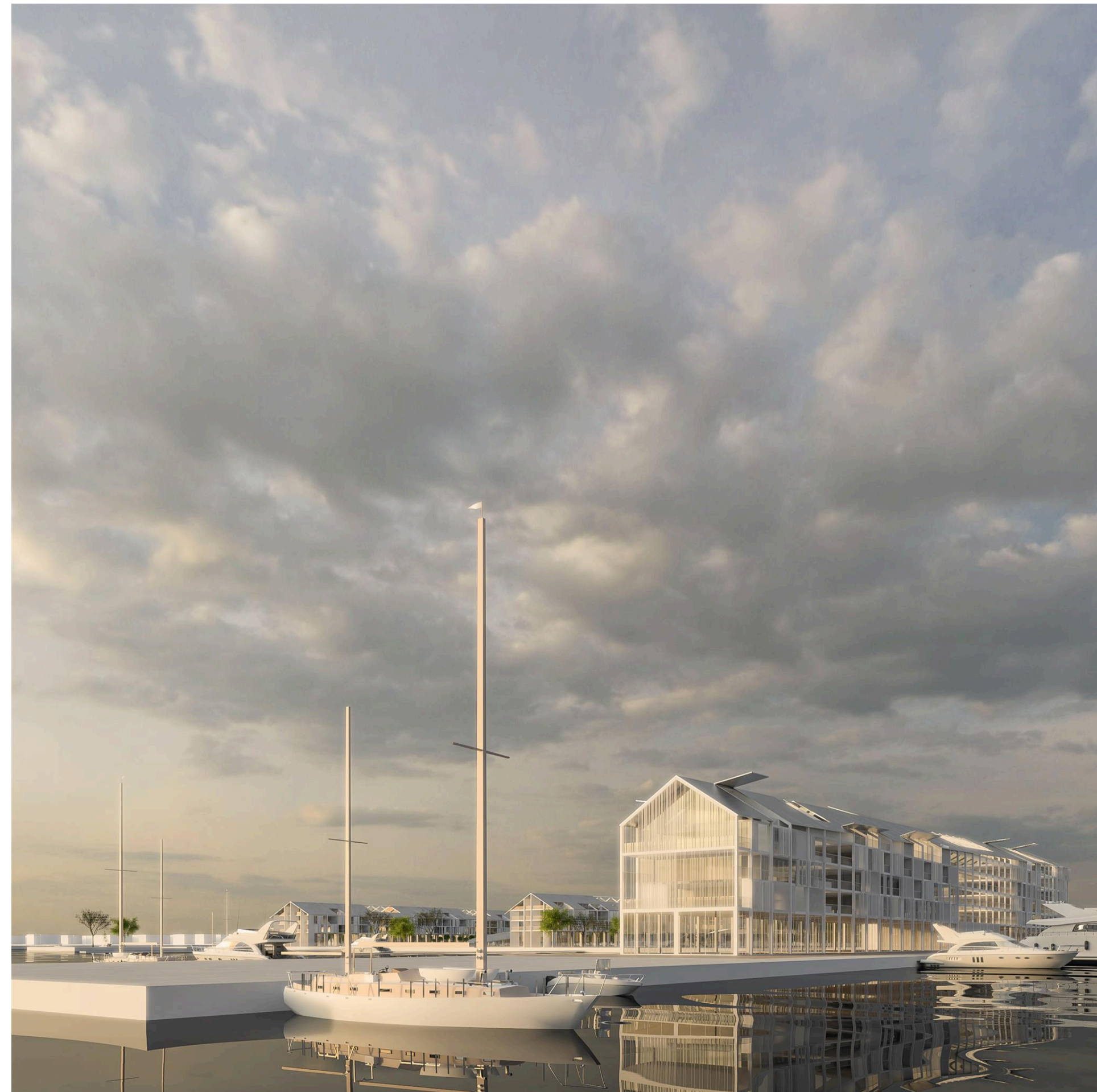
4_Real estate area: hotel, suite e attività commerciali