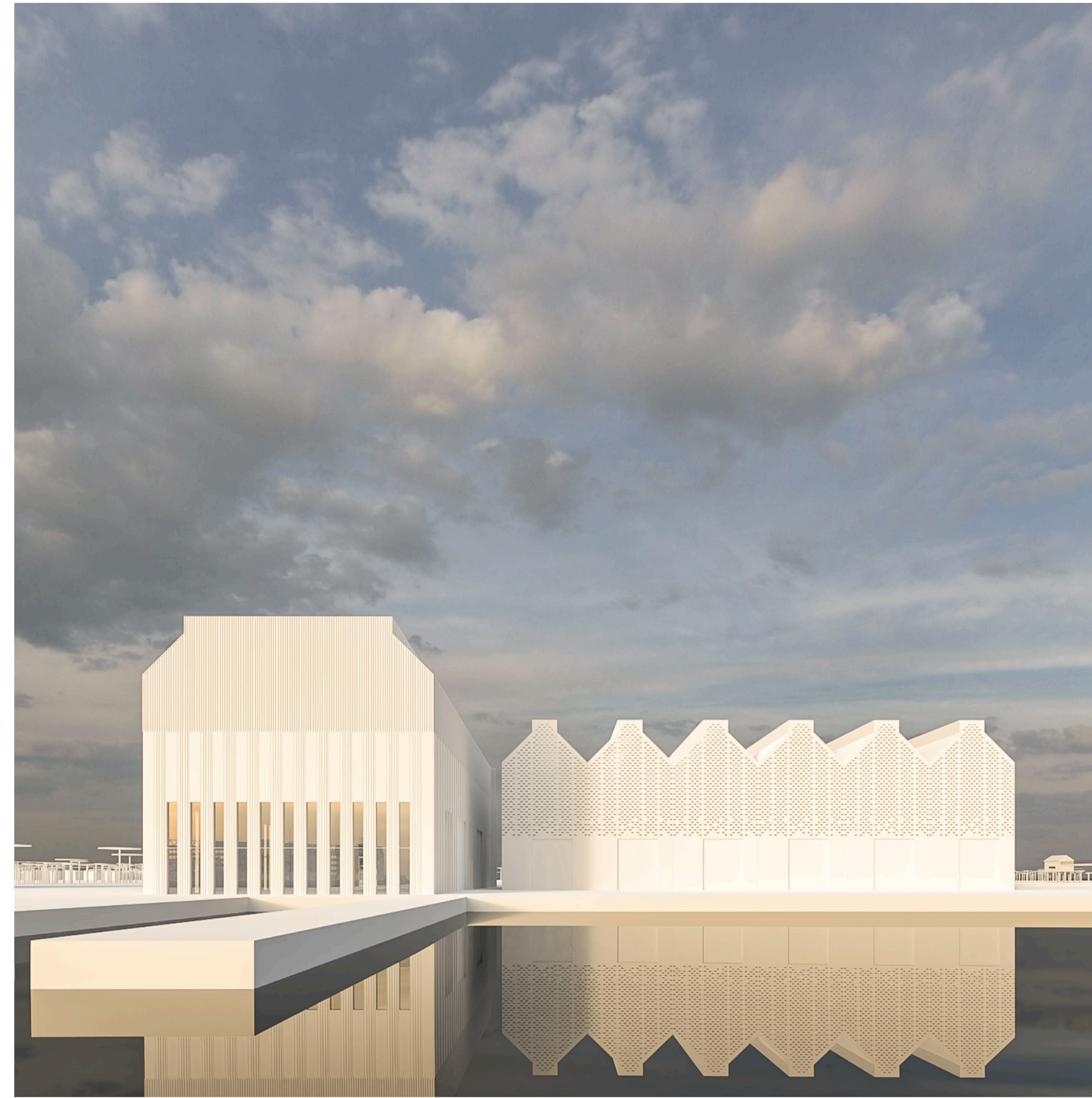
3_Shipyard area: i cantieri navali