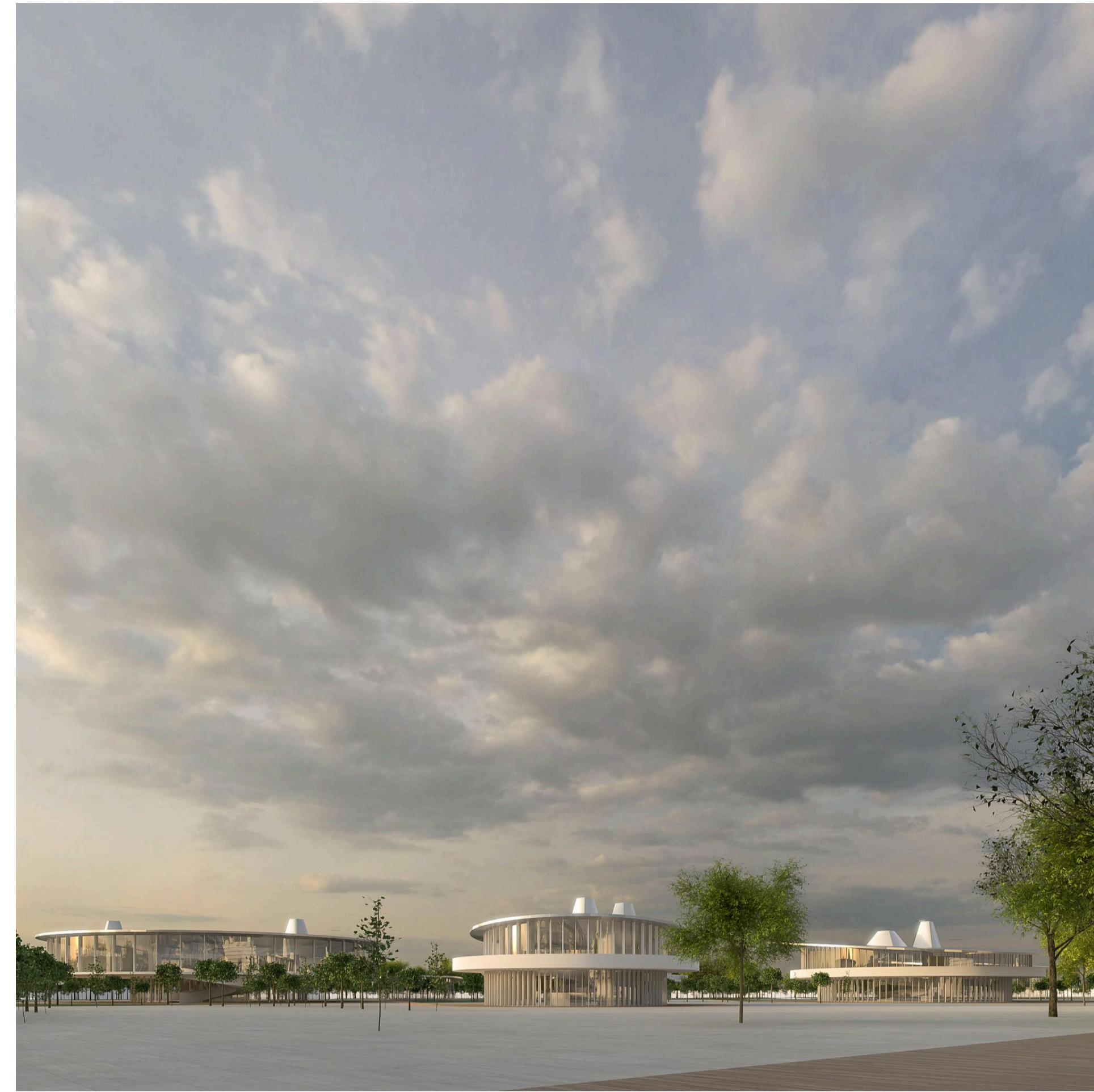
2_Co-working Start up Area: uffici, direzionale, fitness club e bar