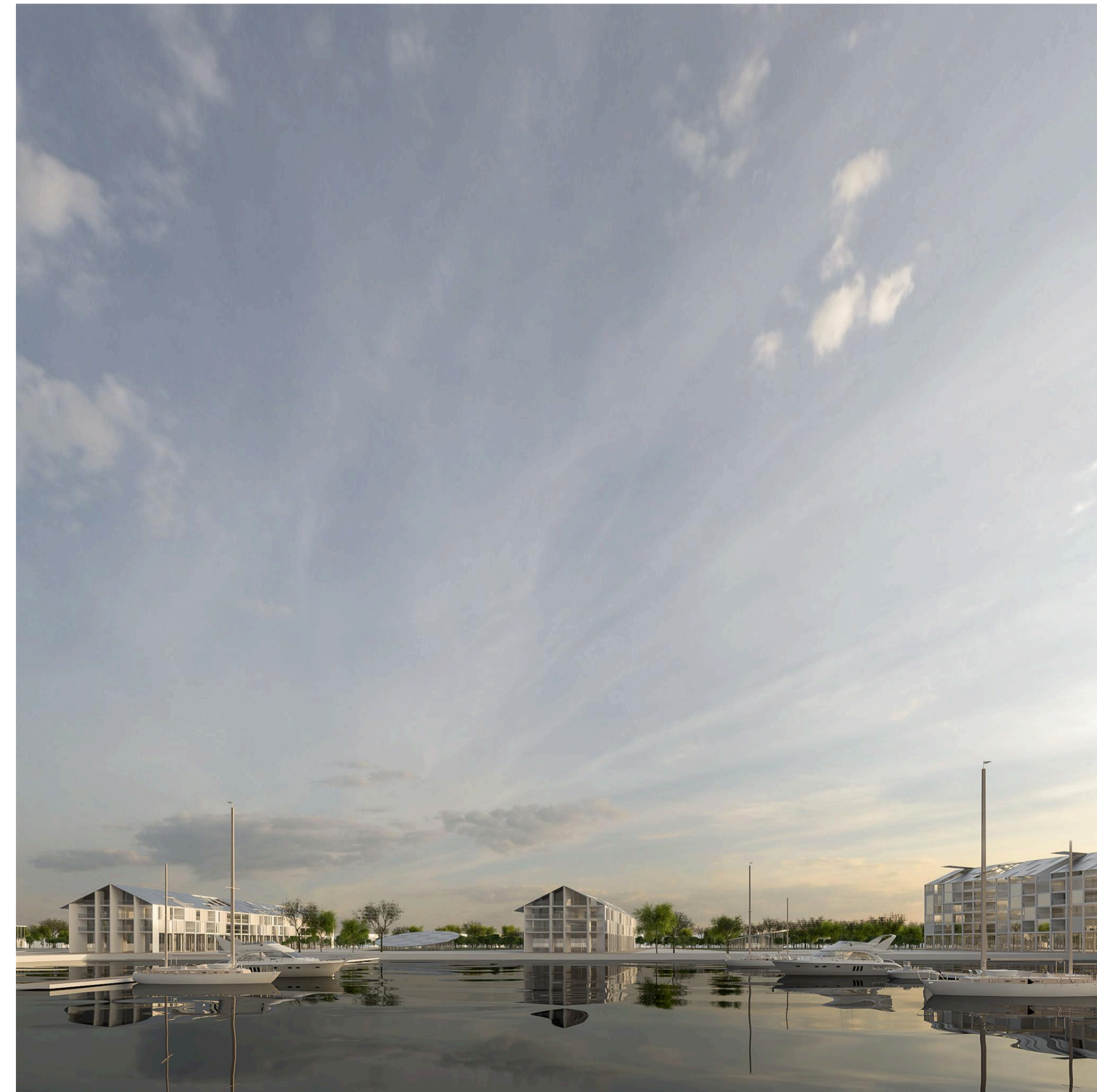
5_Real estate area: le residenze