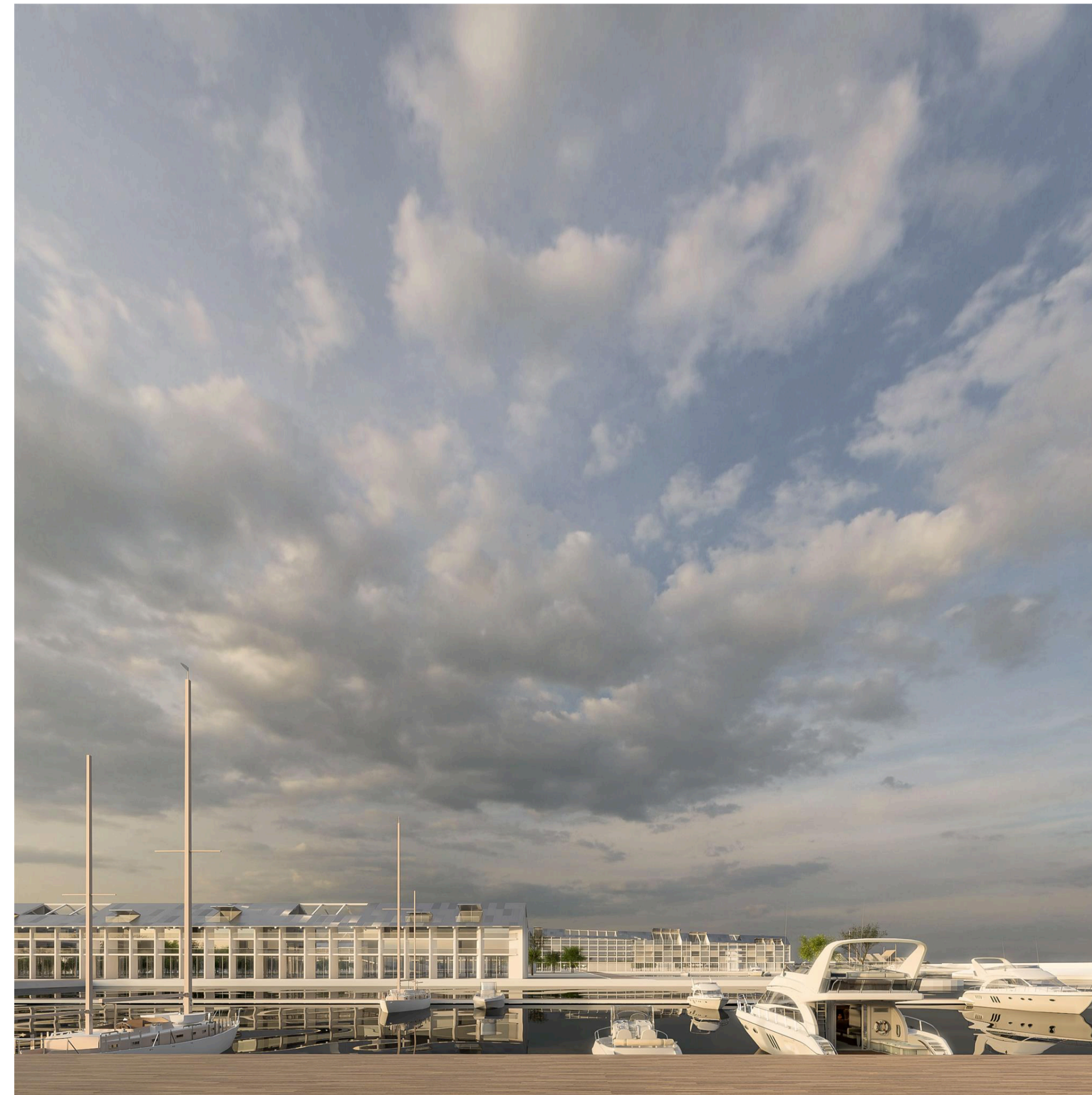
6_Real estate area: le residenze

ISTANZA DI CONVOCAZIONE DI CONFERENZA DEI SERVIZI PRELIMINARE AI SENSI DELL'ART.14 E SEGUENTI, L.241/1990 PER MODIFICA DEI TITOLI CONVENZIONALI ED ABILITATIVI, IVI COMPRESA LA CONCESSIONE DEMANIALE MARITTIMA, PER LA REALIZZAZIONE, IL COMPLETAMENTO E LA GESTIONE DEL PORTO TURISTICO DI FIUMICINO, LOCALITA' ISOLA SACRA