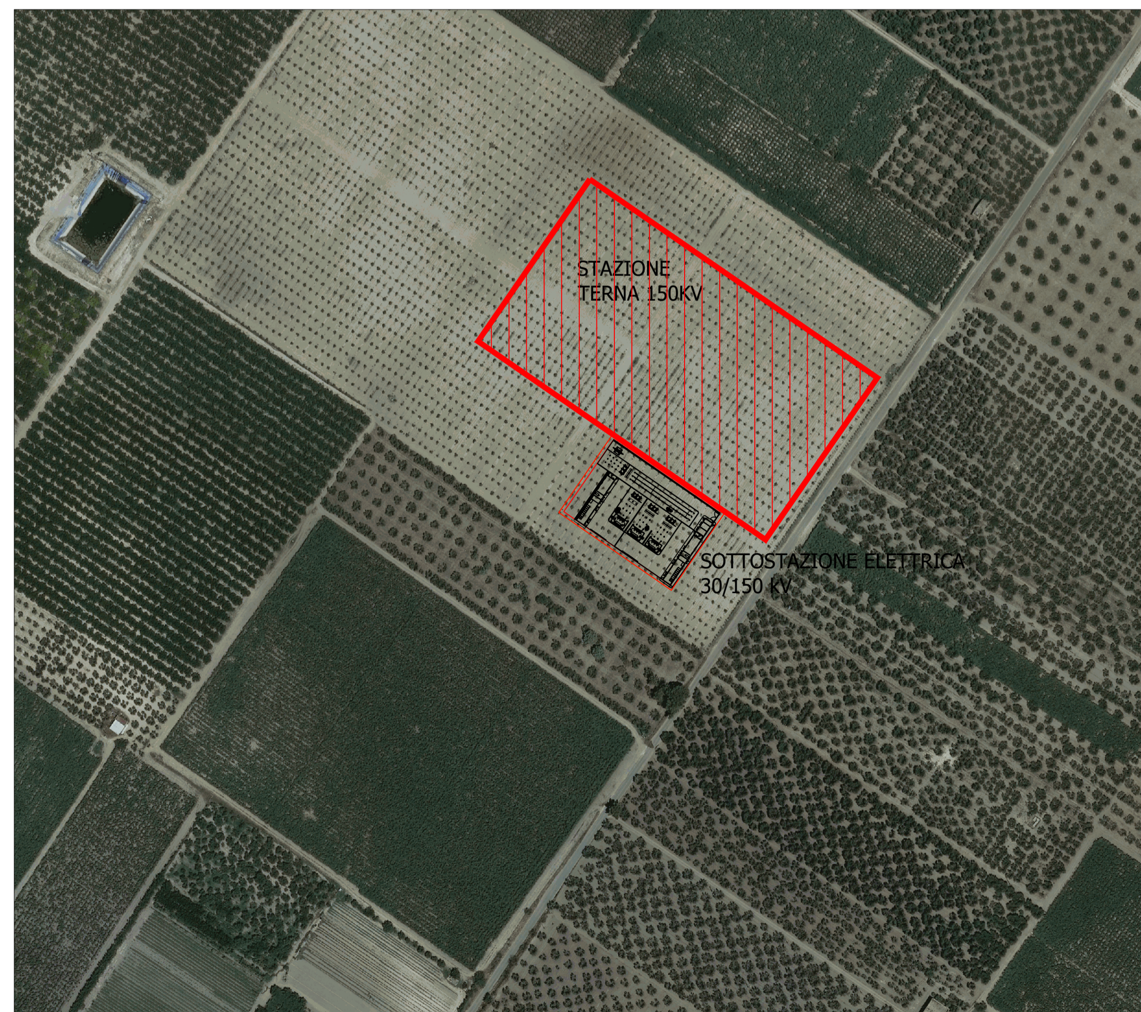
Inquadramento su Ortofoto