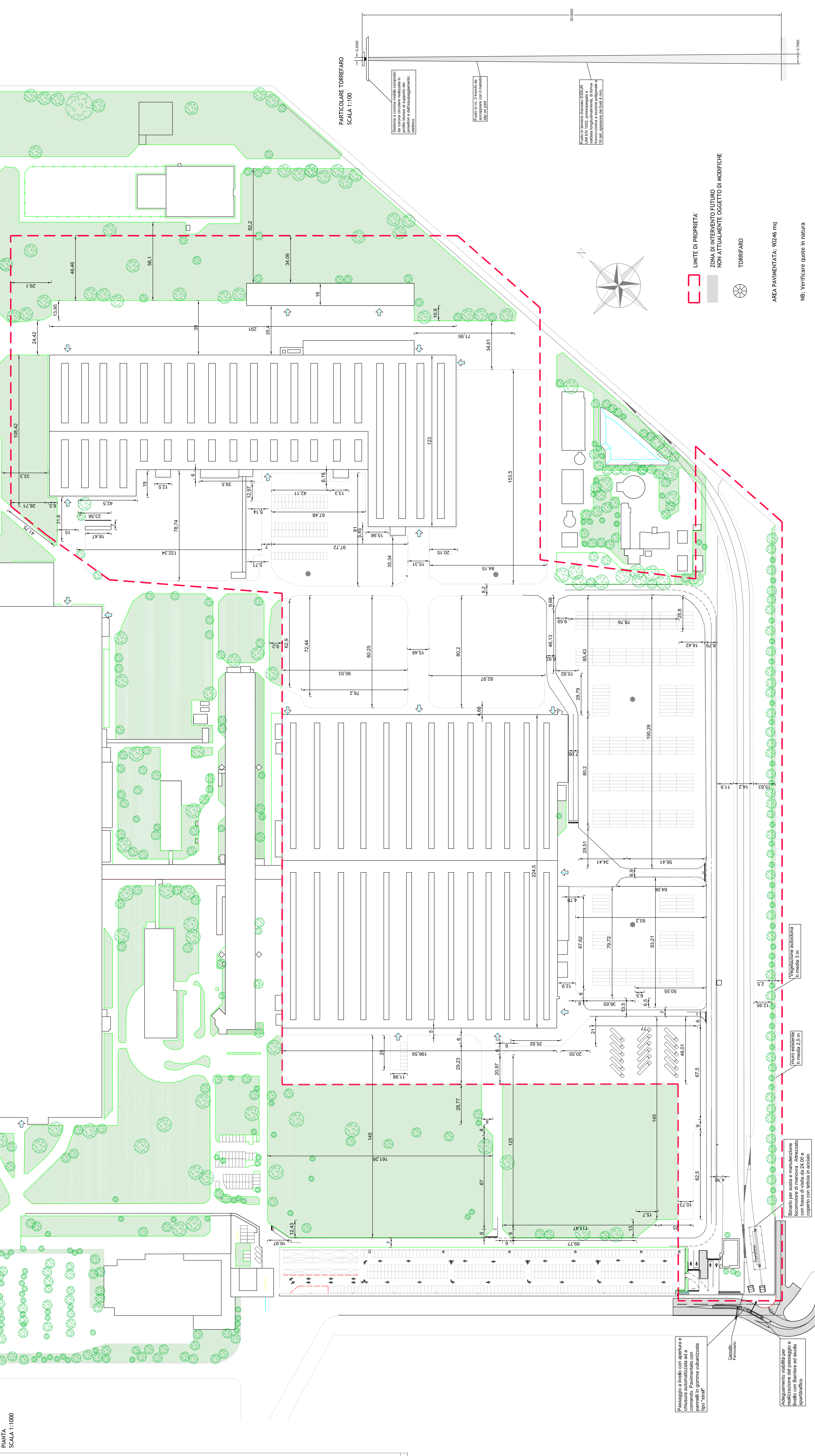
PIANTA SCALA 1:1000