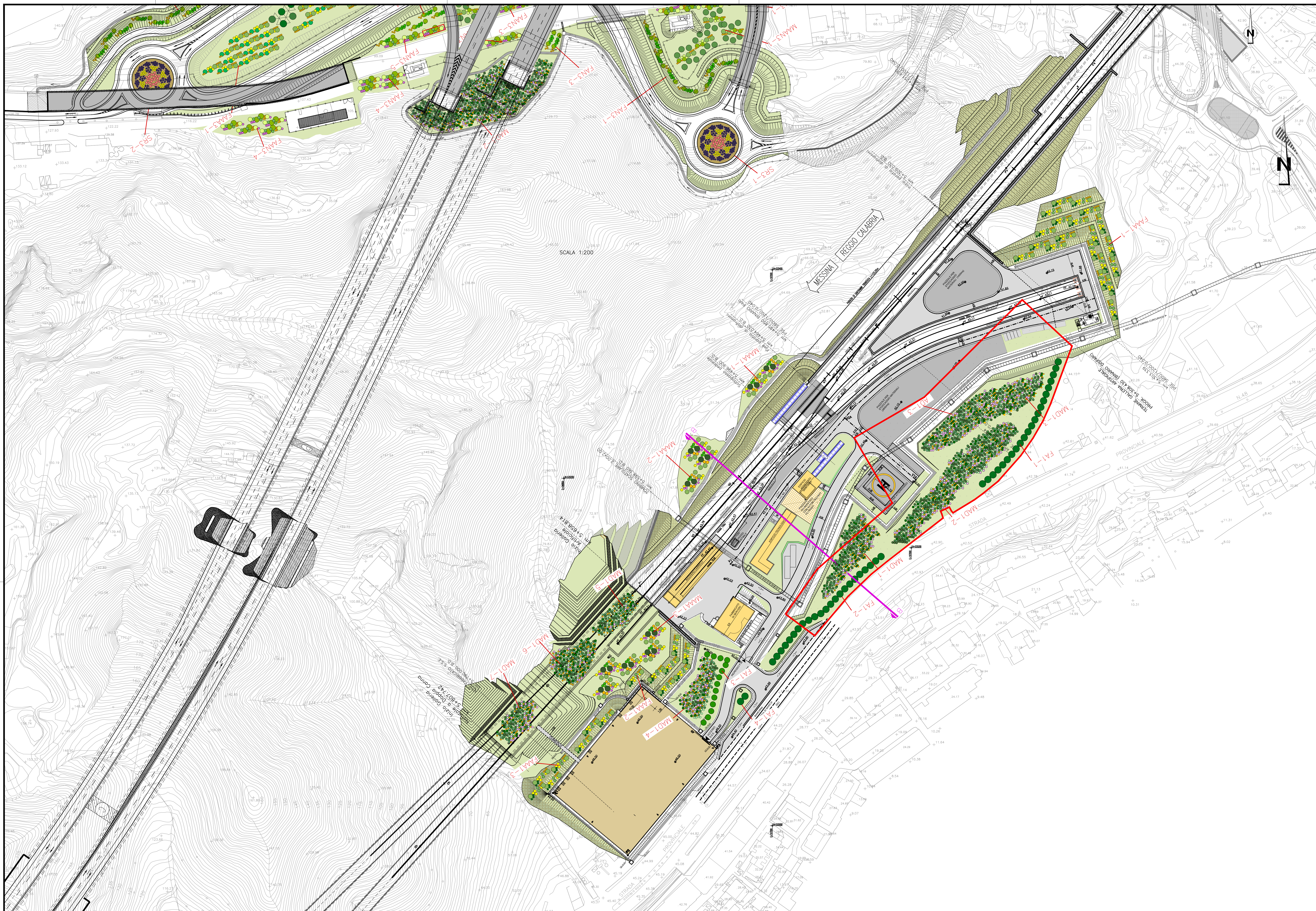
SEZIONE BB scala 1:200