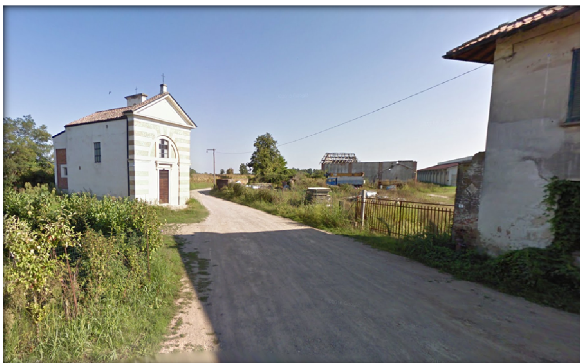
Foto 8 – Via Mendosio in corrispondenza del tratto di strada sterrata

Il tratto di strada in questione attraversa la zona industriale di Mendosio, situata a sud della S.S. 494 Vigevanese, dove sono presenti numerosi capannoni industriali, arrivando a passare davanti a vecchie case coloniche, ad immobili destinati all'attività agricola e ad una piccola chiesetta. La sezione della carreggiata si riduce progressivamente, arrivando ad essere larga circa 4,00 metri. Inoltre, nel tratto finale, non è presente pavimentazione stradale, infatti la strada non è asfaltata, come si può evincere dalla foto 8. Da questo punto in poi la strada procede attraversando i terreni agricoli delle campagne circostanti.