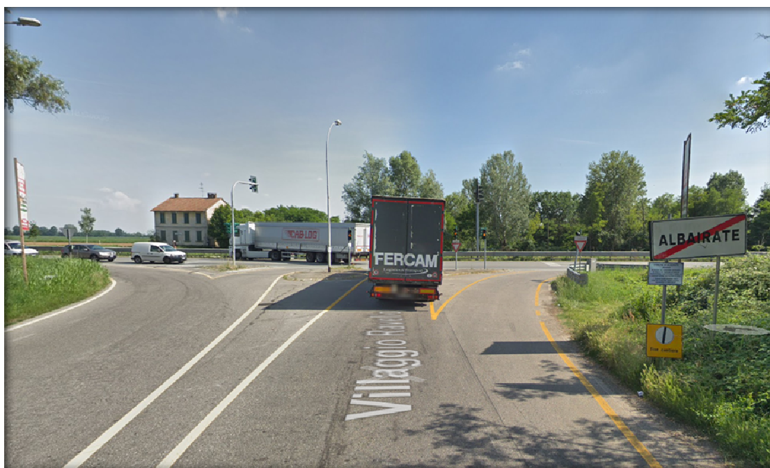
Foto 7 – Intersezione tra Via Villaggio Ravello e S.S. 494 Vigevanese

Il collegamento con la S.S. 494 Vigevanese, avviene tramite un'intersezione a raso, che attualmente presenta problematiche relative a punti di conflitto di intersezione e attraversamento, regolati con sfalsamento temporale delle traiettorie per mezzo di impianto semaforico (foto 7).