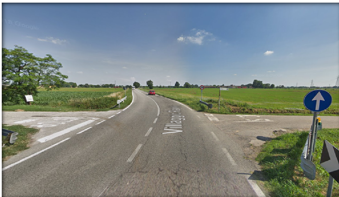
Foto 3 - Intersezione Cascina Tosa

Procedendo verso Sud, l'infrastruttura arriva ad intersecare la viabilità Cascina Tosa. L'intersezione è piuttosto pericolosa per la visibilità ed è regolata da segnale di stop. In questo punto la larghezza della carreggiata rimane compresa tra i 6,00 ed i 6,50 metri, mentre il limite di velocità rimane fissato a 50 Km/h (foto 3).