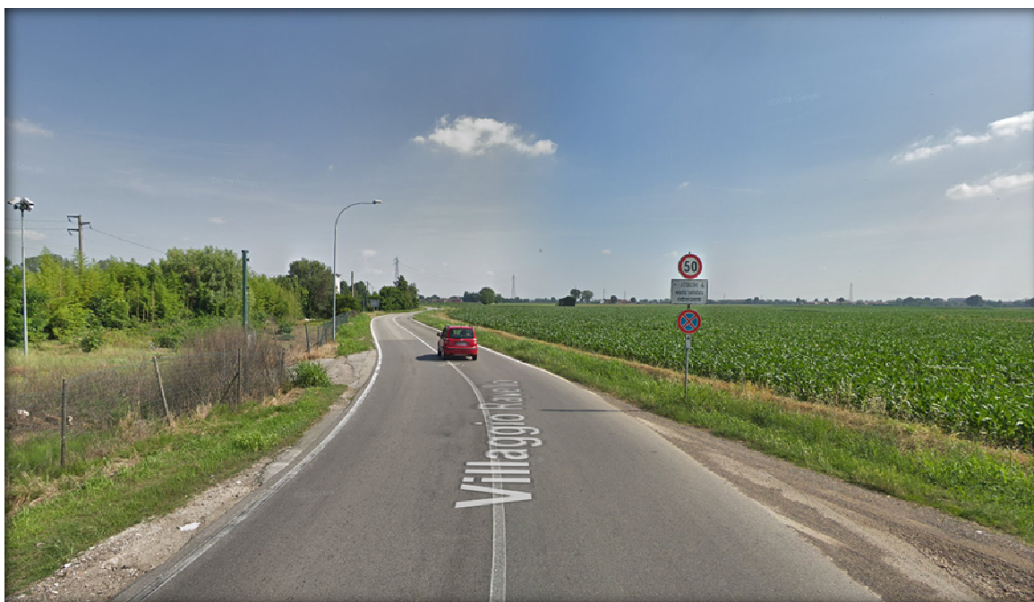
Foto 2 – Via Villaggio Ravello con indicazione dei limiti di velocità

Procedendo verso Sud, l'infrastruttura arriva ad intersecare la viabilità Cascina Tosa. L'intersezione è piuttosto pericolosa per la visibilità ed è regolata da segnale di stop. In questo punto la larghezza della carreggiata rimane compresa tra i 6,00 ed i 6,50 metri, mentre il limite di velocità rimane fissato a 50 Km/h (foto 3).