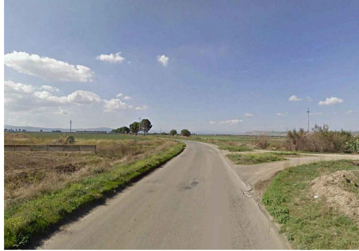
INTERSEZIONE TRA TRATTURI ASFALTATI DIVENUTI STRADA VICINALE E EP 48 BASSO MELFESE