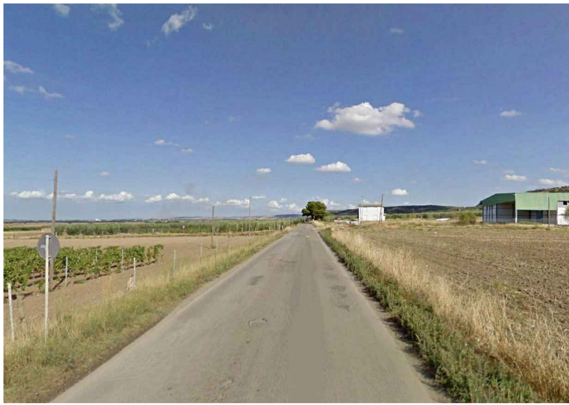
TRATTO DI LUNGHEZZA PARI 1650 m SU STRADA ASFALTATA CORRISPONDENTE ALLA SP 48 DEL BASSO MELFESE (FOTO 2 di 2)