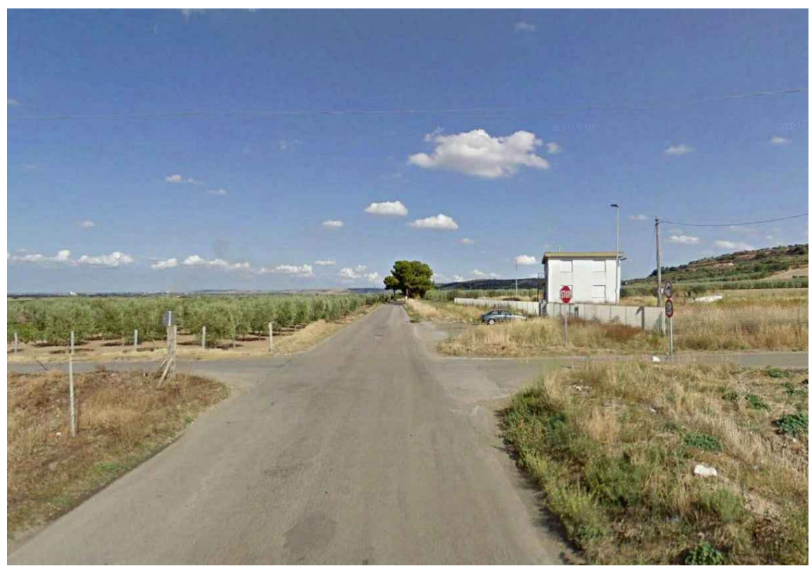
INTERSEZIONE TRA TRATTURI ASFALTATI DIVENUTI SC CIMITERO E EP 48 BASSO MELFESE