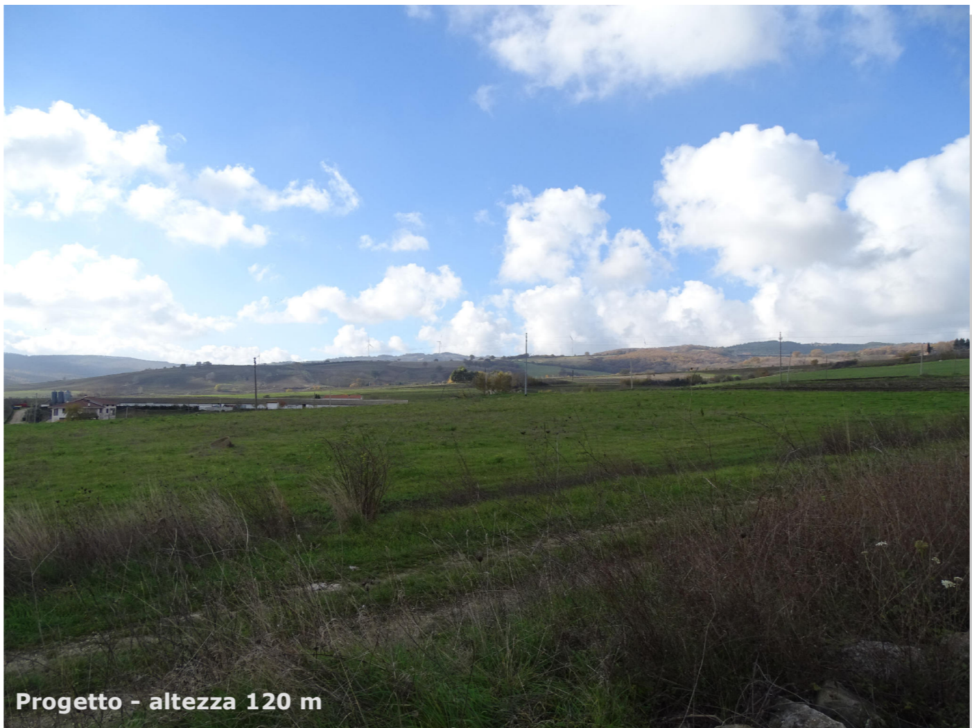
Progetto - altezza 120 m