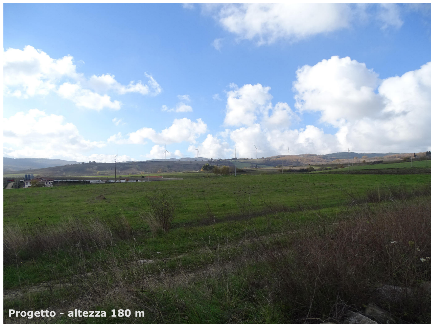
Progetto - altezza 180 m