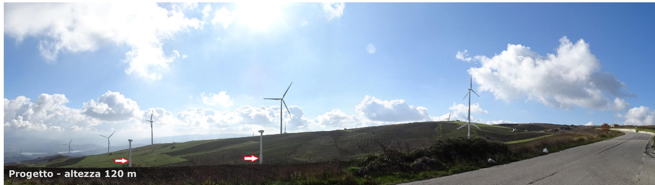
Progetto - altezza 120 m