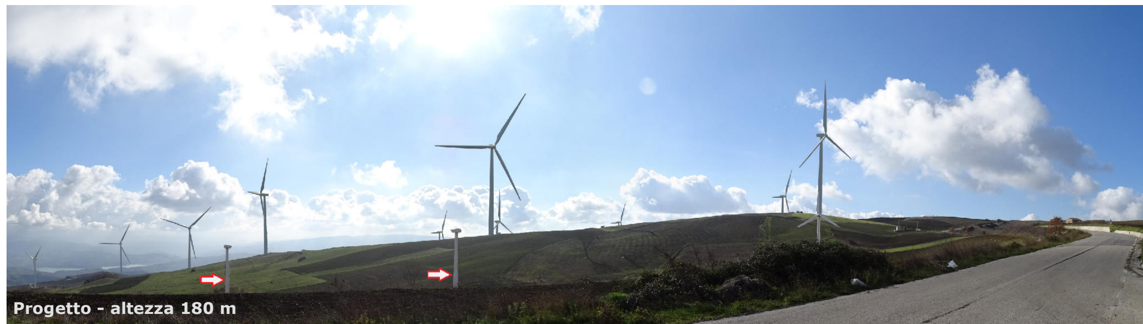
Progetto - altezza 180 m