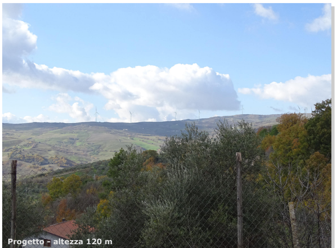
Progetto - altezza 120 m