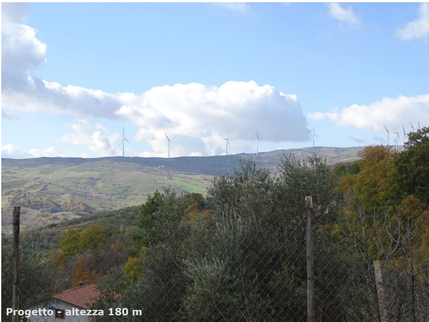
Progetto - altezza 180 m