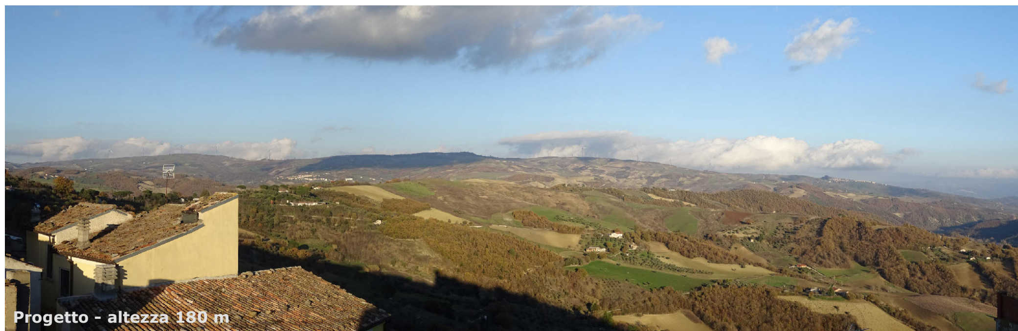
Progetto - altezza 180 m