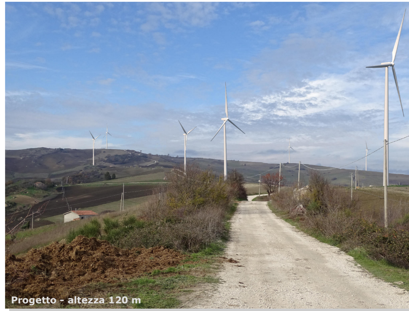
Progetto - altezza 120 m