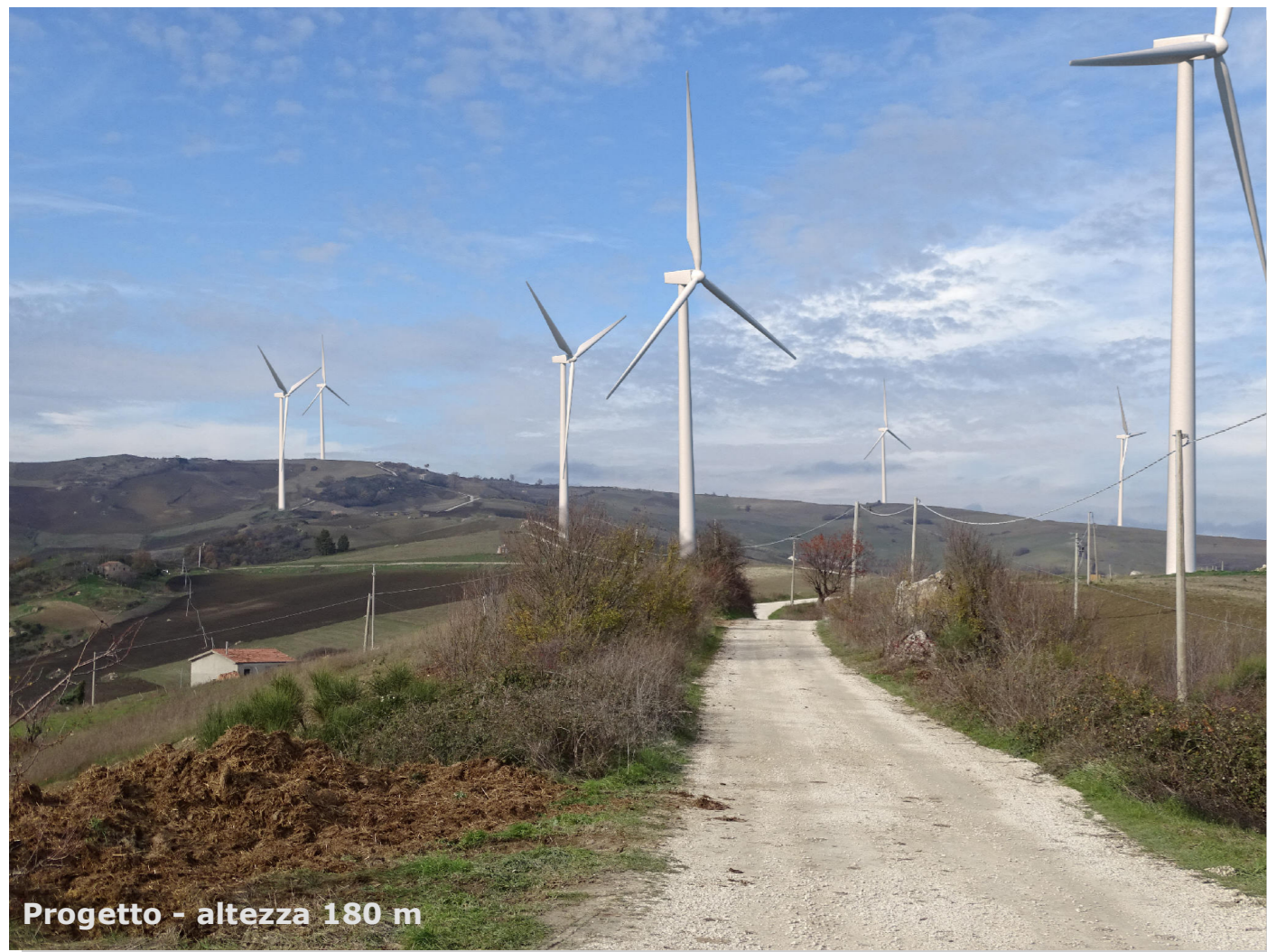
Progetto - altezza 180 m