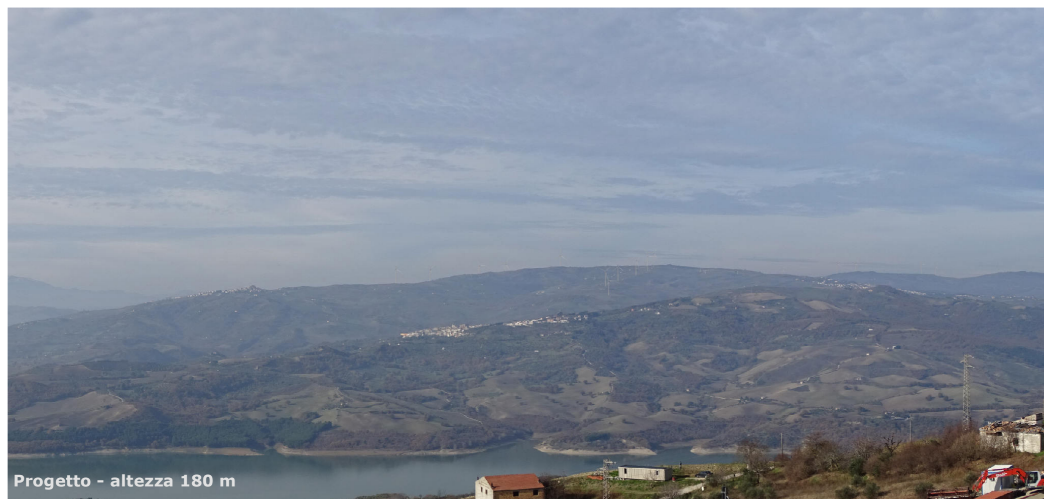
Progetto - altezza 180 m