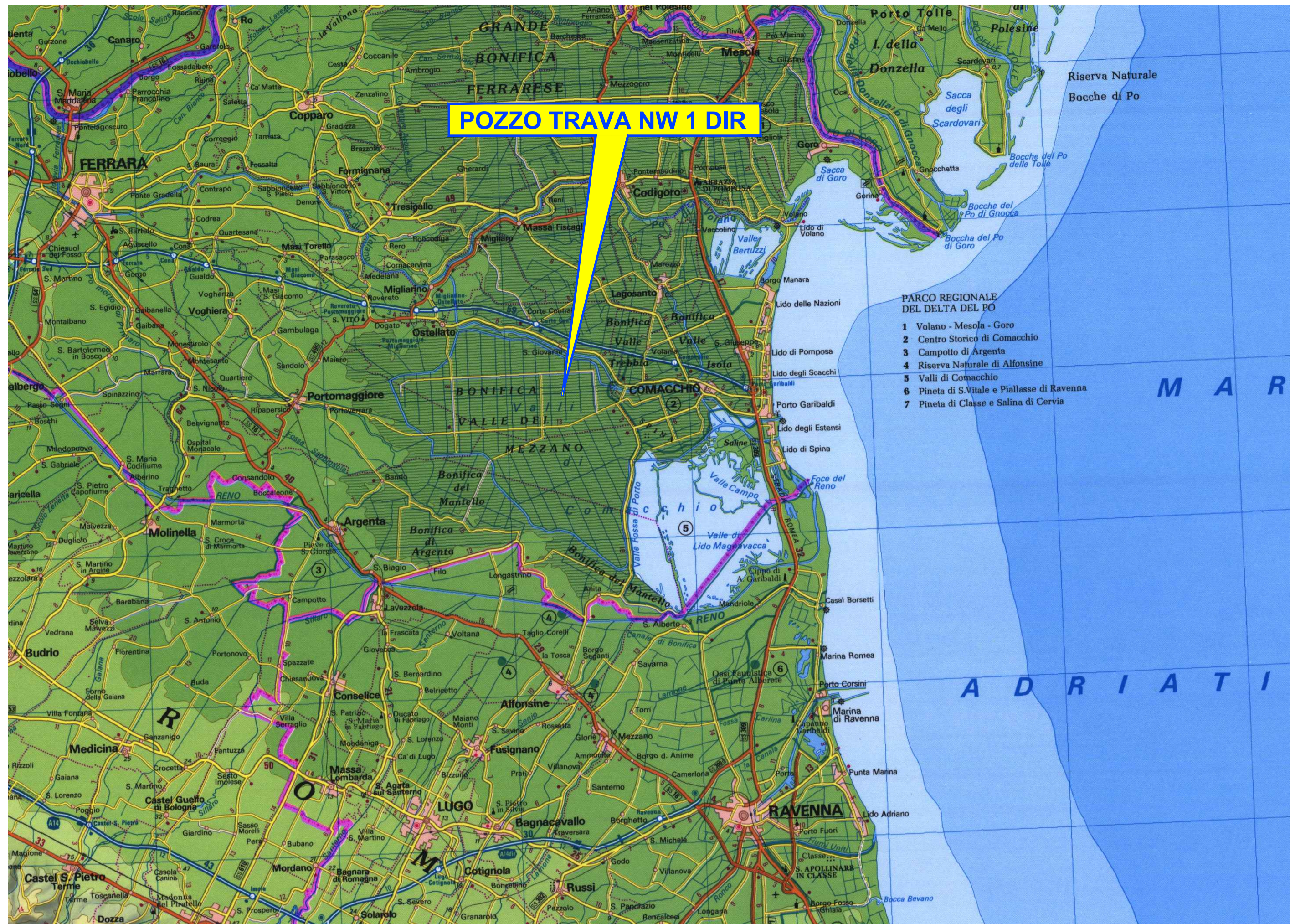
COROGRAFIA GENERALE: STRALCIO DELLA CARTA FISICO POLITICO DELLA REGIONE EMILIA ROMAGNA Scala 1:250.000