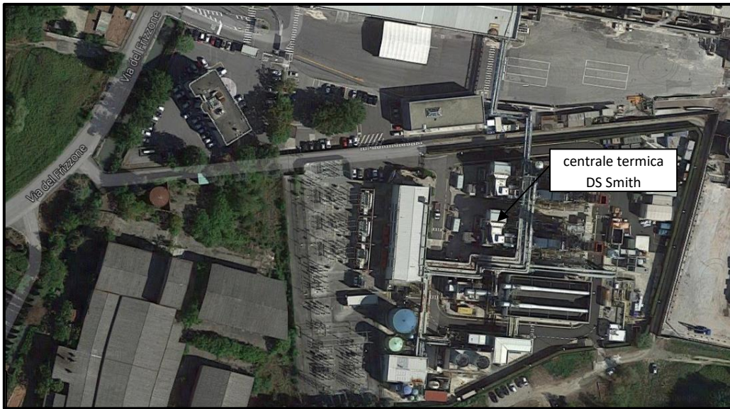
IMMAGINE SATELLITARE DELLA CENTRALE TERMICA DS SMITH ed ESTRATTI CARTOGRAFICI DAL COMUNE DI PORCARI IN CUI SI EVIDENZIA LA DESTINAZIONE INDUSTRIALE DELL'AREA IN ESAME