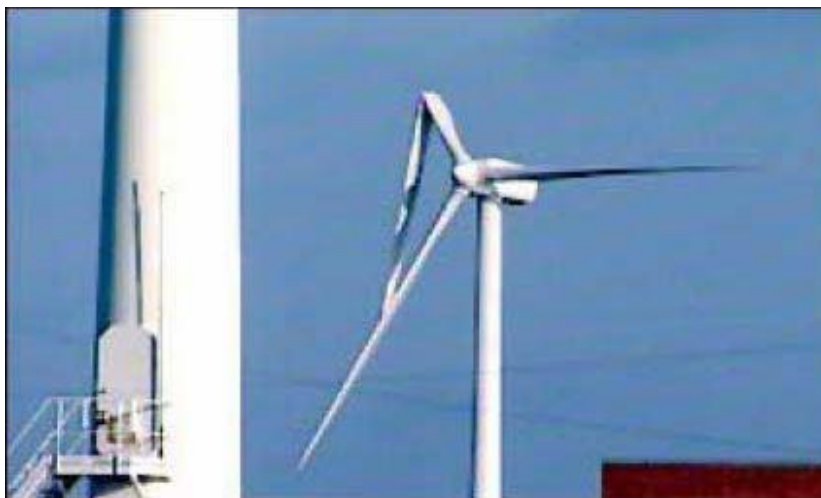
Figure 3 - Esempio di rottura di pala senza distacco

Nella maggior parte dei casi il distacco di piccoli frammenti di pala si verifica in concomitanza con fulminazioni di natura atmosferica.