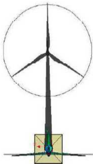
Proiezione dell'ombra indotta dall'aerogeneratore con rotore perpendicolare alla linea sole - recettore