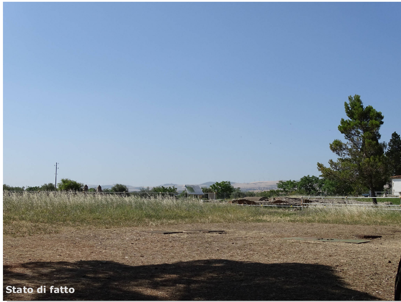
Stato di fatto