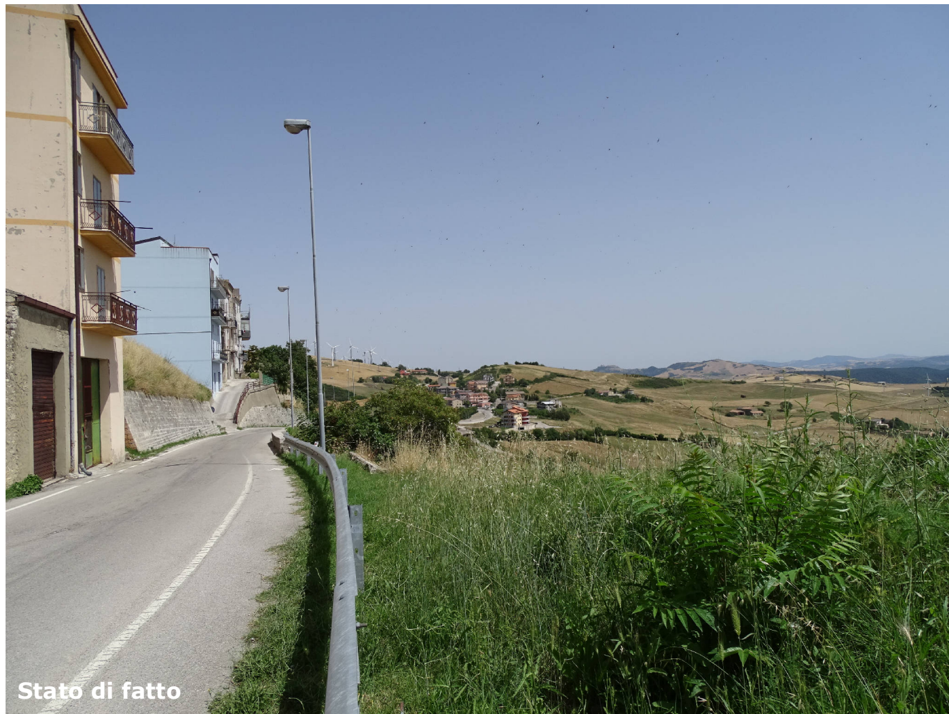
Stato di fatto