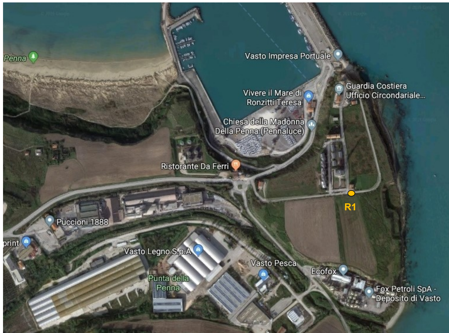
Ubicazione del ricettore abitativo R1