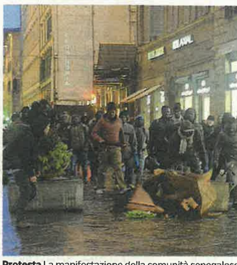
Protesta La manifestazione della comunità senegalese