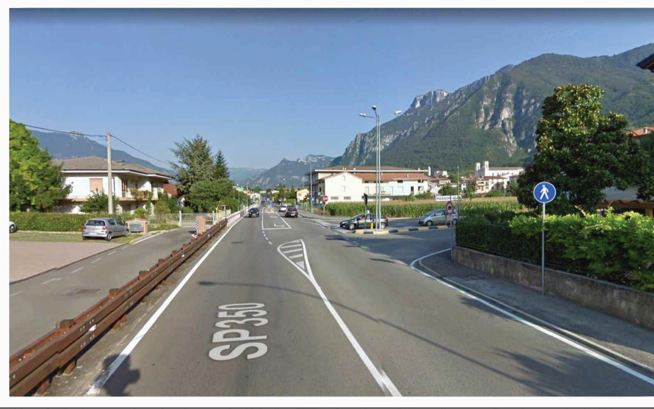
Intervento 1: messa in sicurezza dell'intersezione con via don Giuseppe Contro in comune di Cogollo del Cengio, con realizzazione di una rotondina.