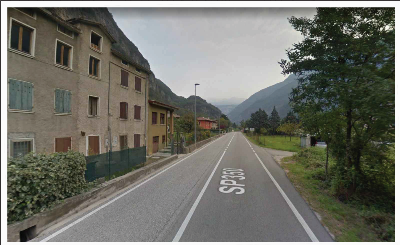
Intervento 6: messa in sicurezza dei transiti pedonali nella frazione Scalin in comune di Arsiero.