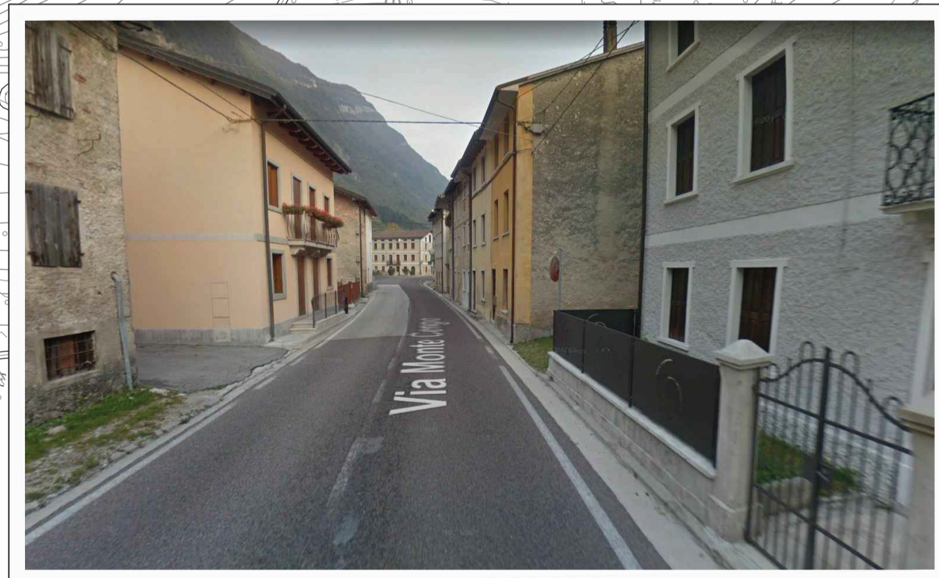
Intervento 9: interventi di messa in sicurezza dell'attraversamento della frazione Forni in comune di Valdastico.