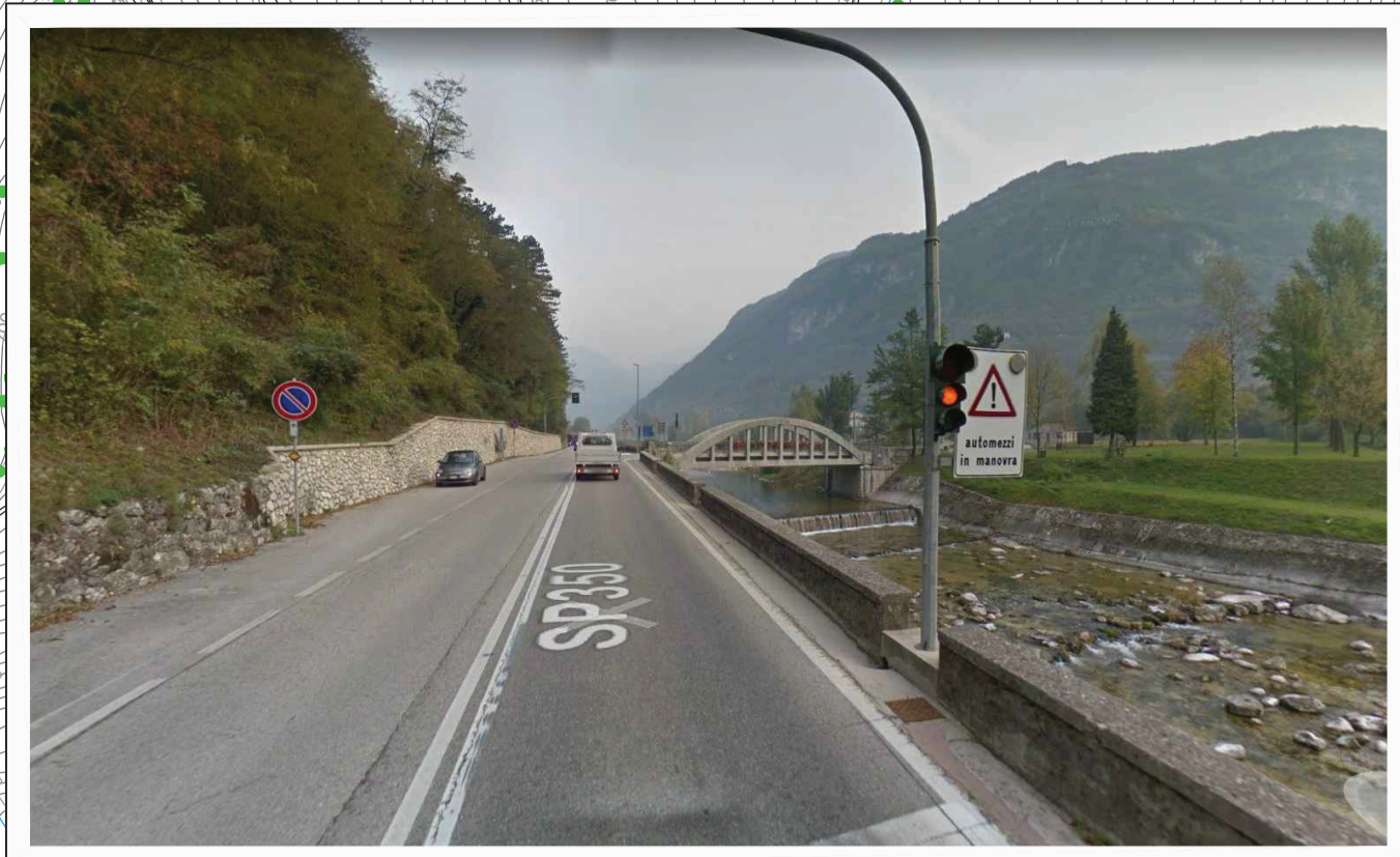
Intervento 8: aggiunta di una nuova opera di attraversamento del torrente Astico (realizzando un manufatto definitivo il luogo di quello provvisorio già previsto per la cantierizzazione) in affiancamento al ponte esistente, in località Pedescala in comune di Valdastico.