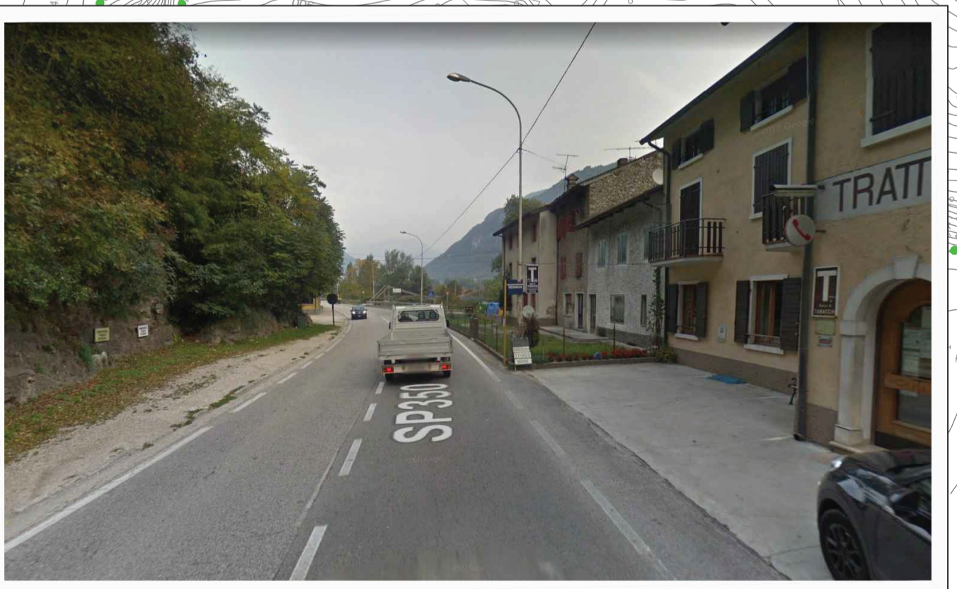
Intervento 7: messa in sicurezza, con realizzazione di attraversamenti pedonali e riqualifica della fermata del bus, nella frazione Barcarola in comune di Arsiero.