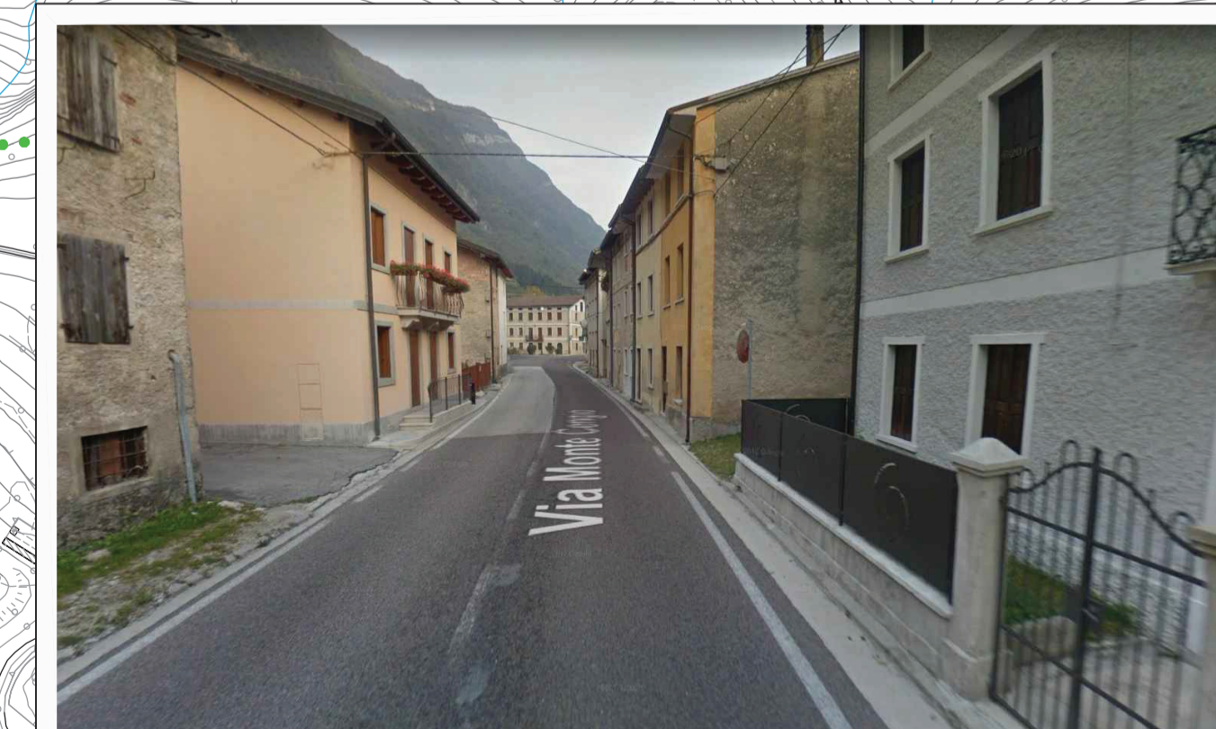
Intervento 9: interventi di messa in sicurezza dell'attraversamento della frazione Forni in comune di Valdastico.