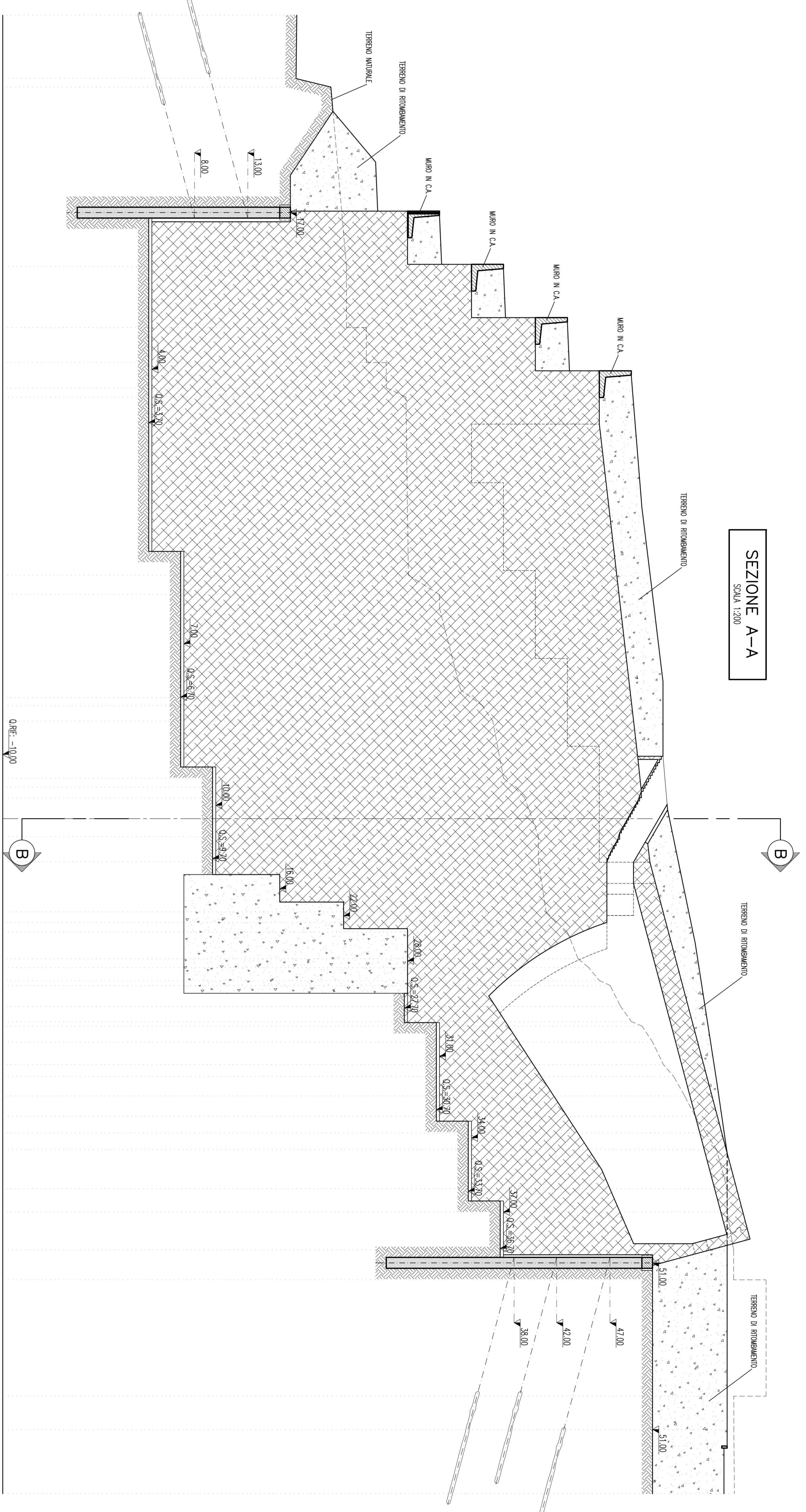
SEZIONE A-A Scala 1:200