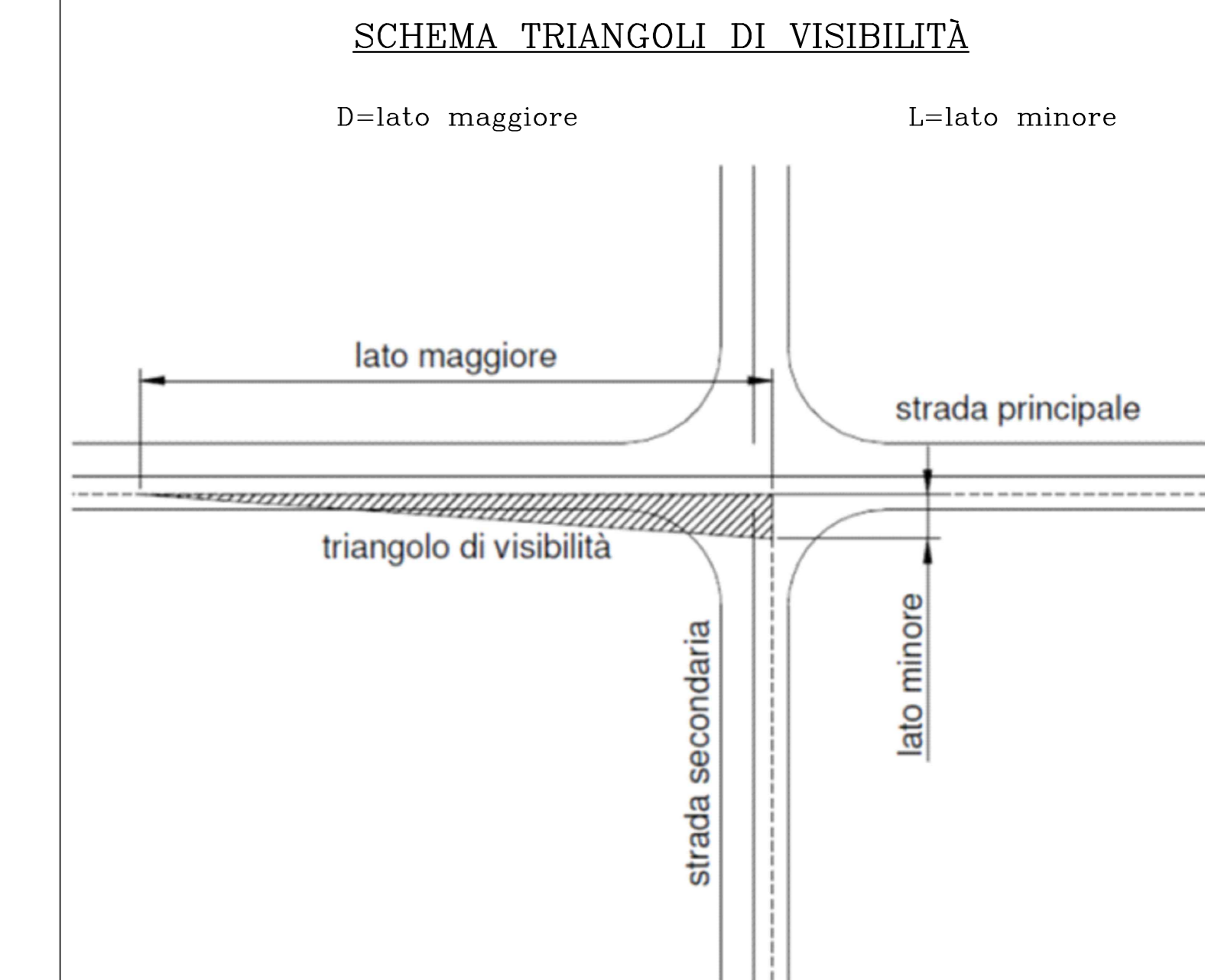
TABELLA RIEPILOGATIVA CON CARATTERISTICHE DELLE INTERSEZIONI E DEI RELATIVI TRIANGOLI DI VISIBILITÀ