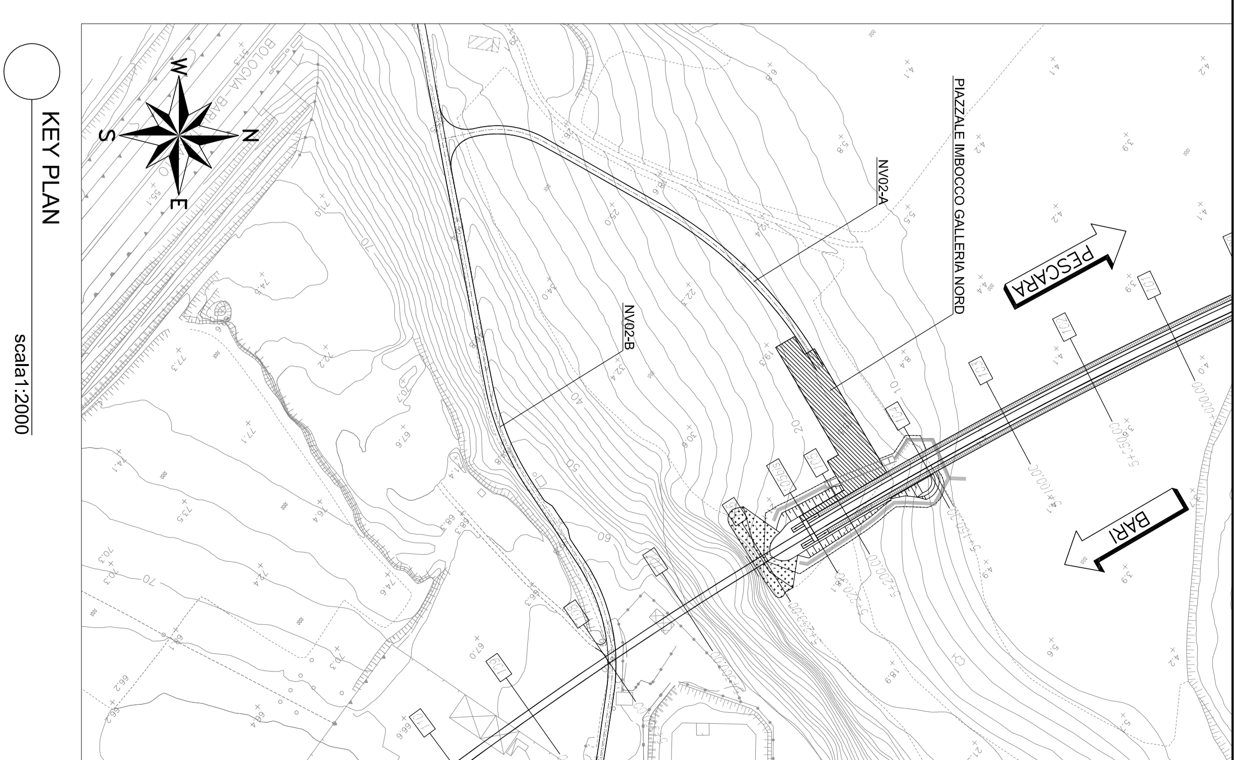
KEY PLAN SCALA 1:2000

NOTE: - PER LE CARATTERISTICHE DEI MATERIALI ED INCIDENZA ANNUNCIARE SI RIMANDA AGLI ELABORATI SPECIFICI