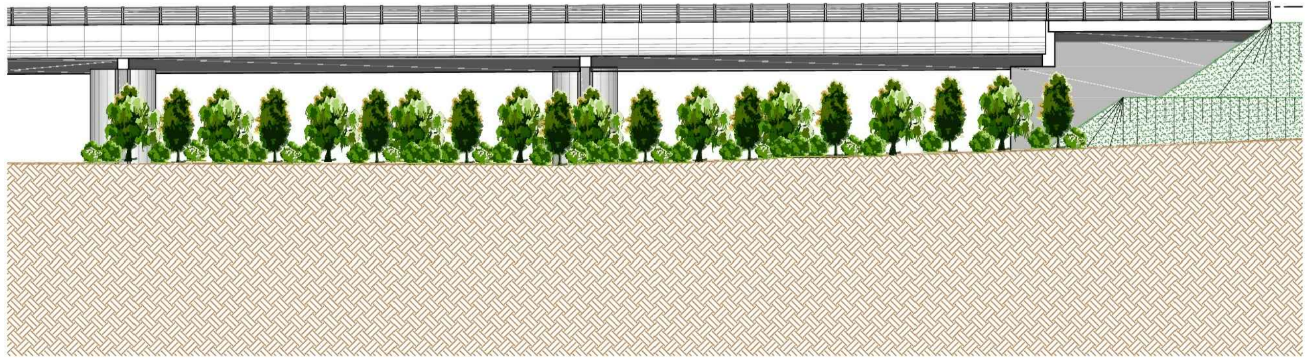
SEZIONE TIPO - VI06