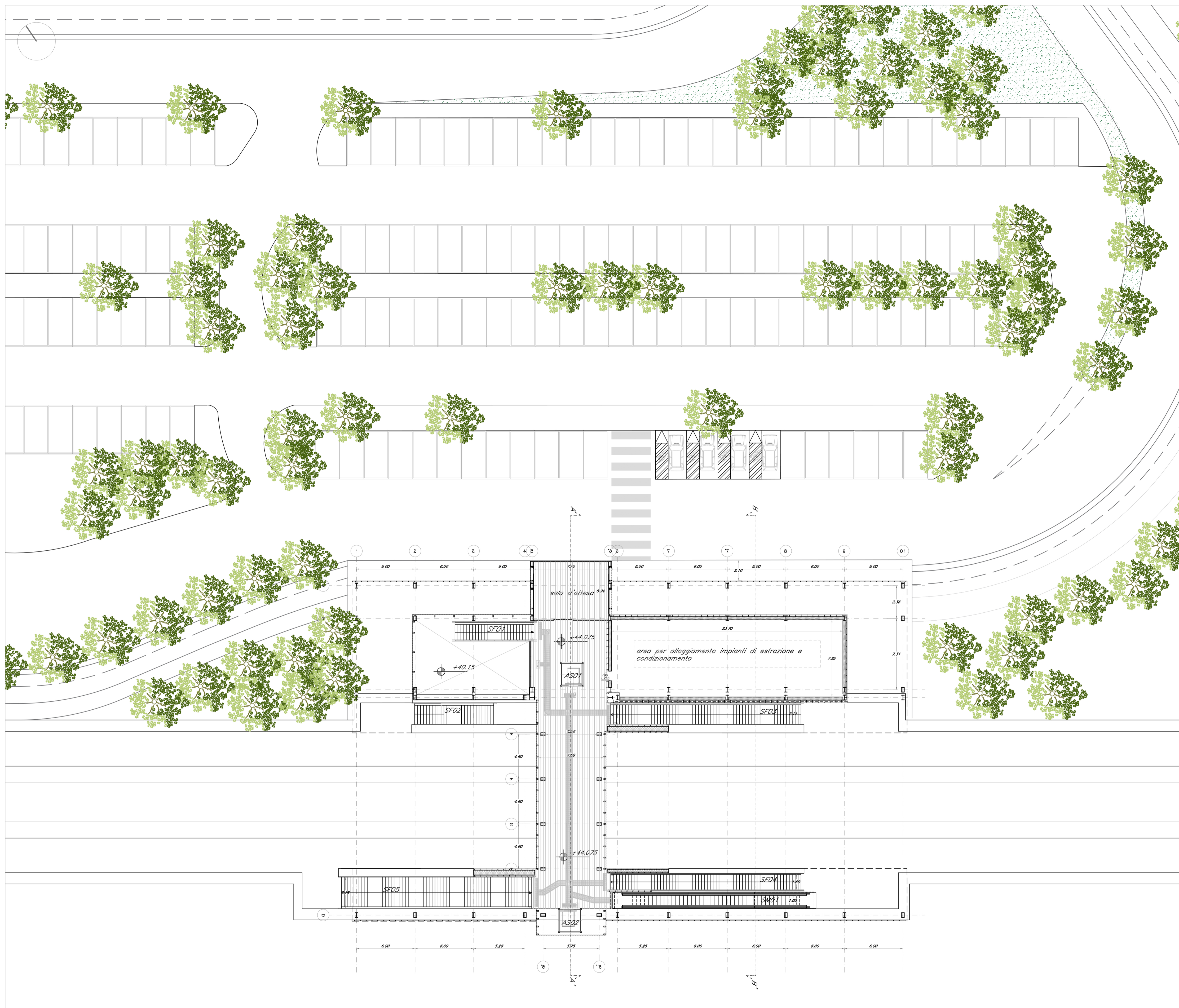
Pianta quota sovrappasso scala 1:200