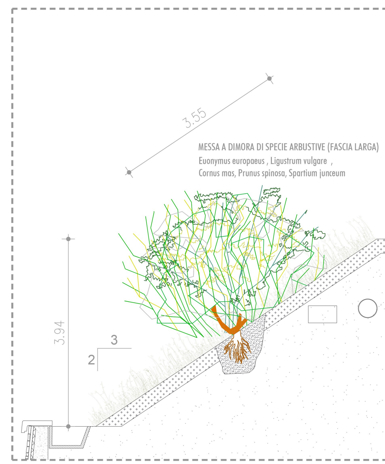
PARTICOLARE B: SISTEMAZIONE A VERDE DELLE SCARPATE SCALA 1:50