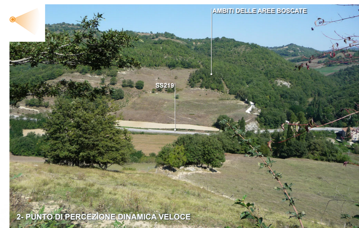
2 - PUNTO DI PERCEZIONE DINAMICA VELOCE