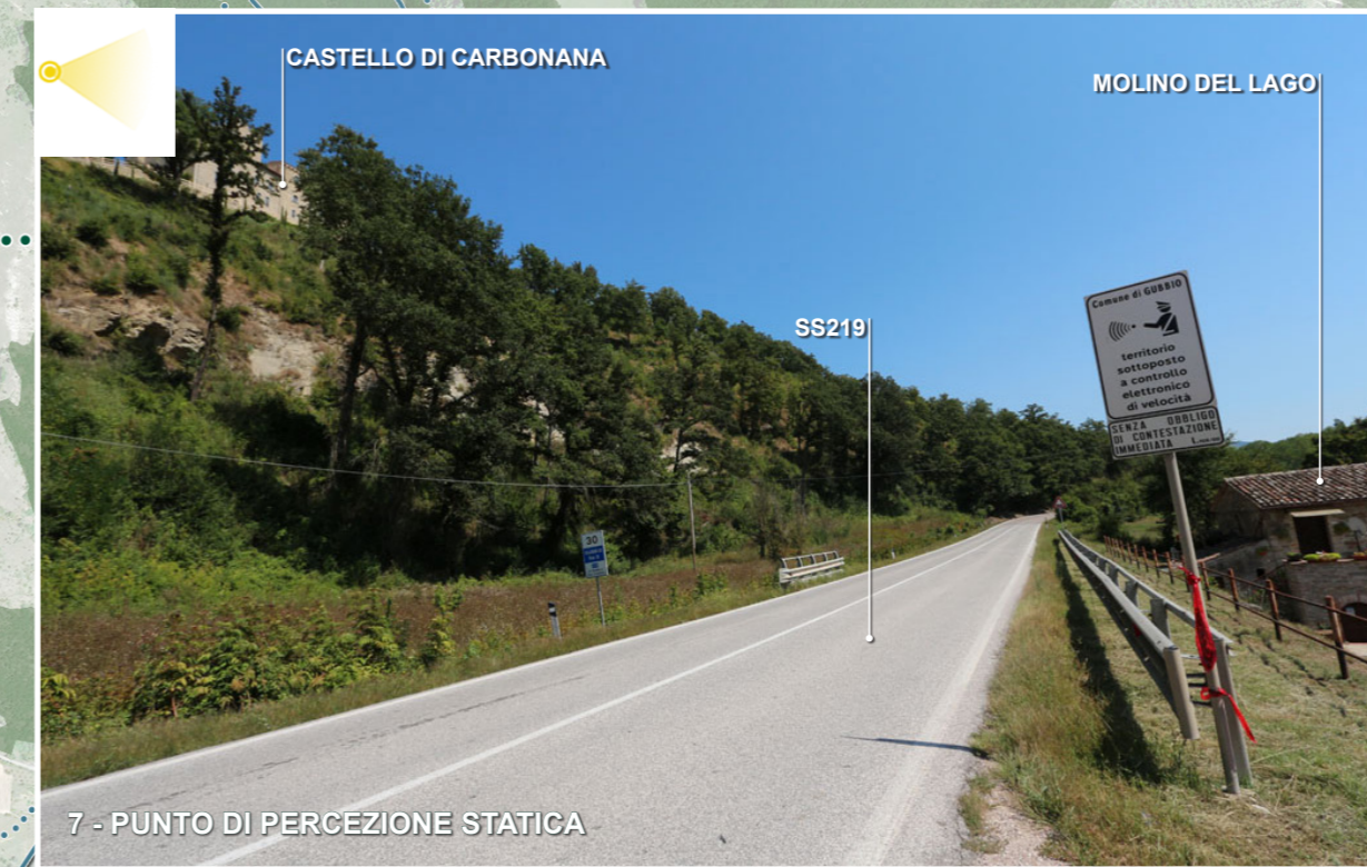
7 - PUNTO DI PERCEZIONE STATICA