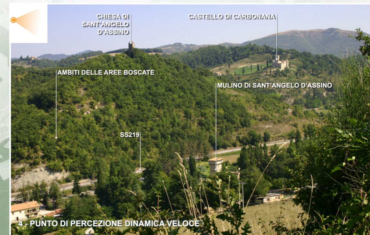
4 - PUNTO DI PERCEZIONE DINAMICA VELOCE