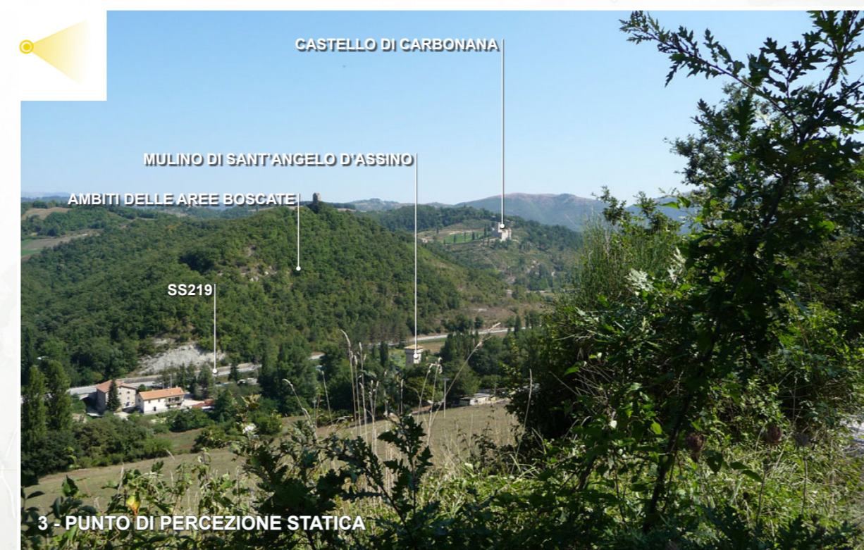
3 - PUNTO DI PERCEZIONE STATICA