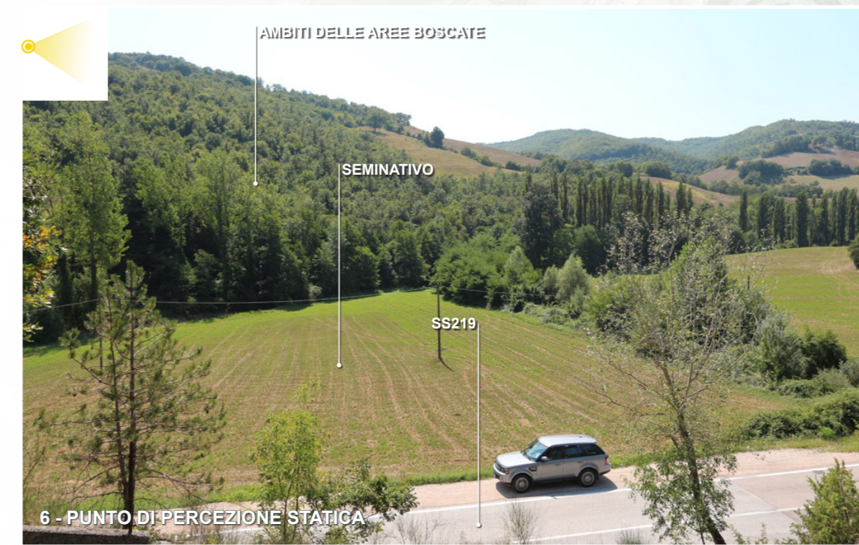
6 - PUNTO DI PERCEZIONE STATICA