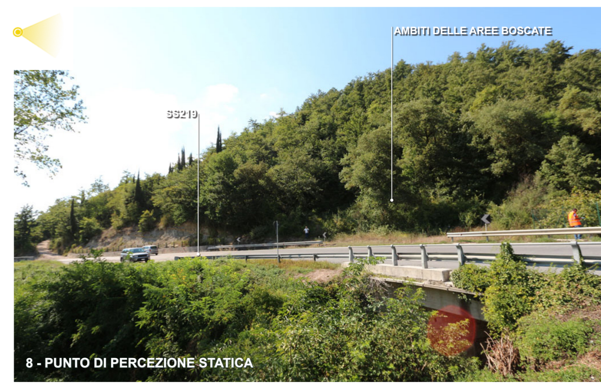
8 - PUNTO DI PERCEZIONE STATICA