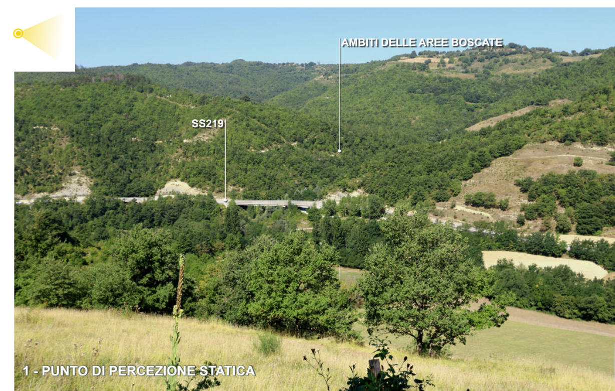
1 - PUNTO DI PERCEZIONE STATICA