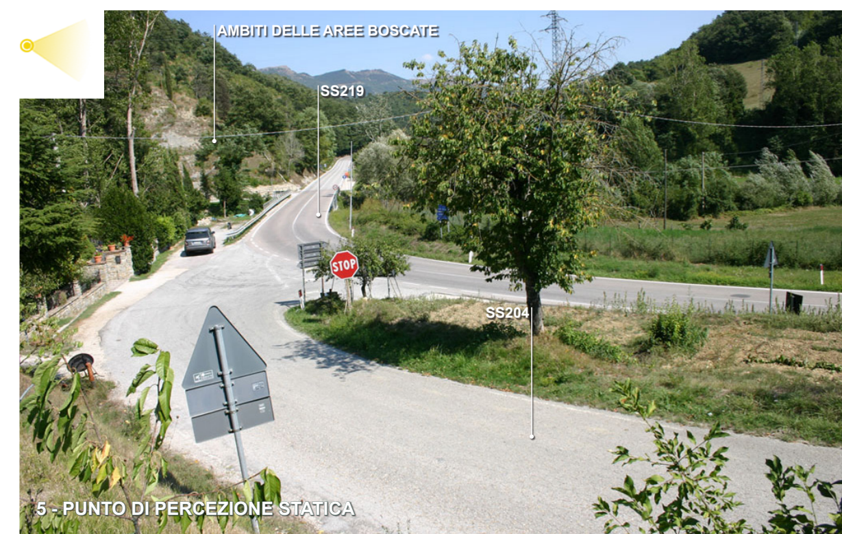
5 - PUNTO DI PERCEZIONE STATICA