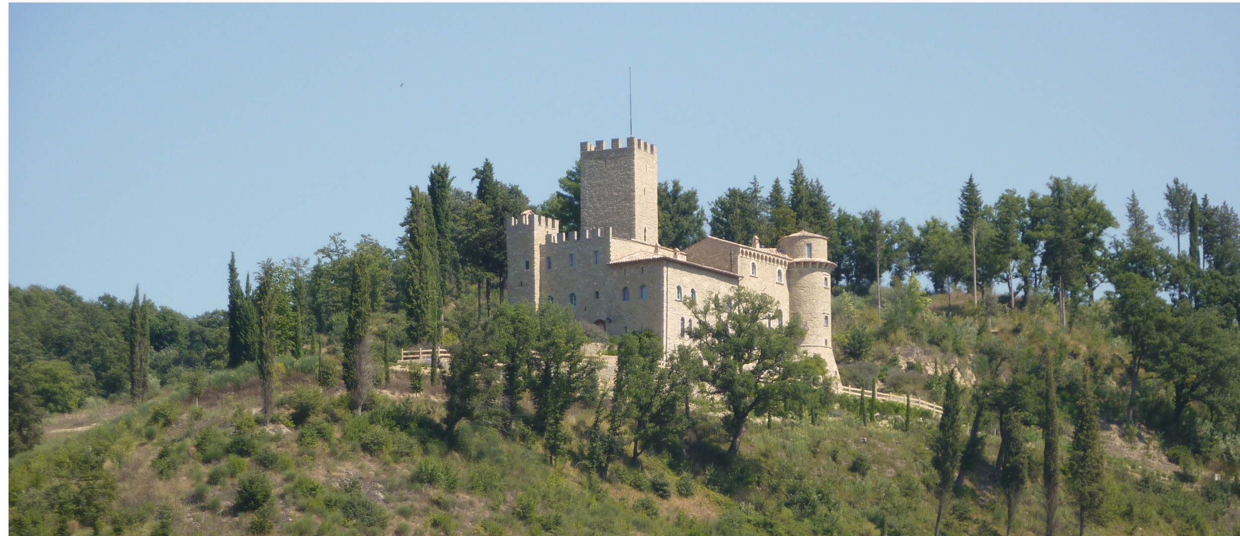
AMBITO INSEDIATIVO STORICO