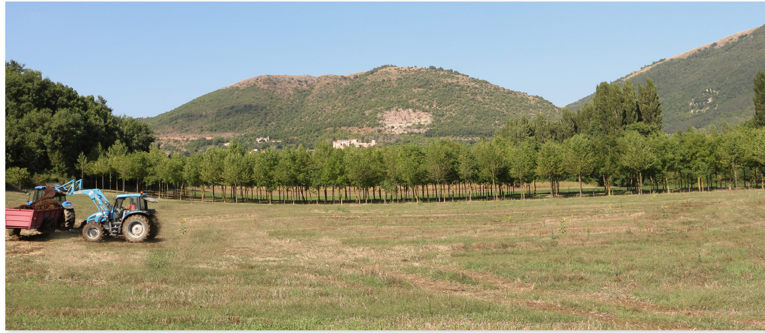
AMBITO AGRICOLO RURALE