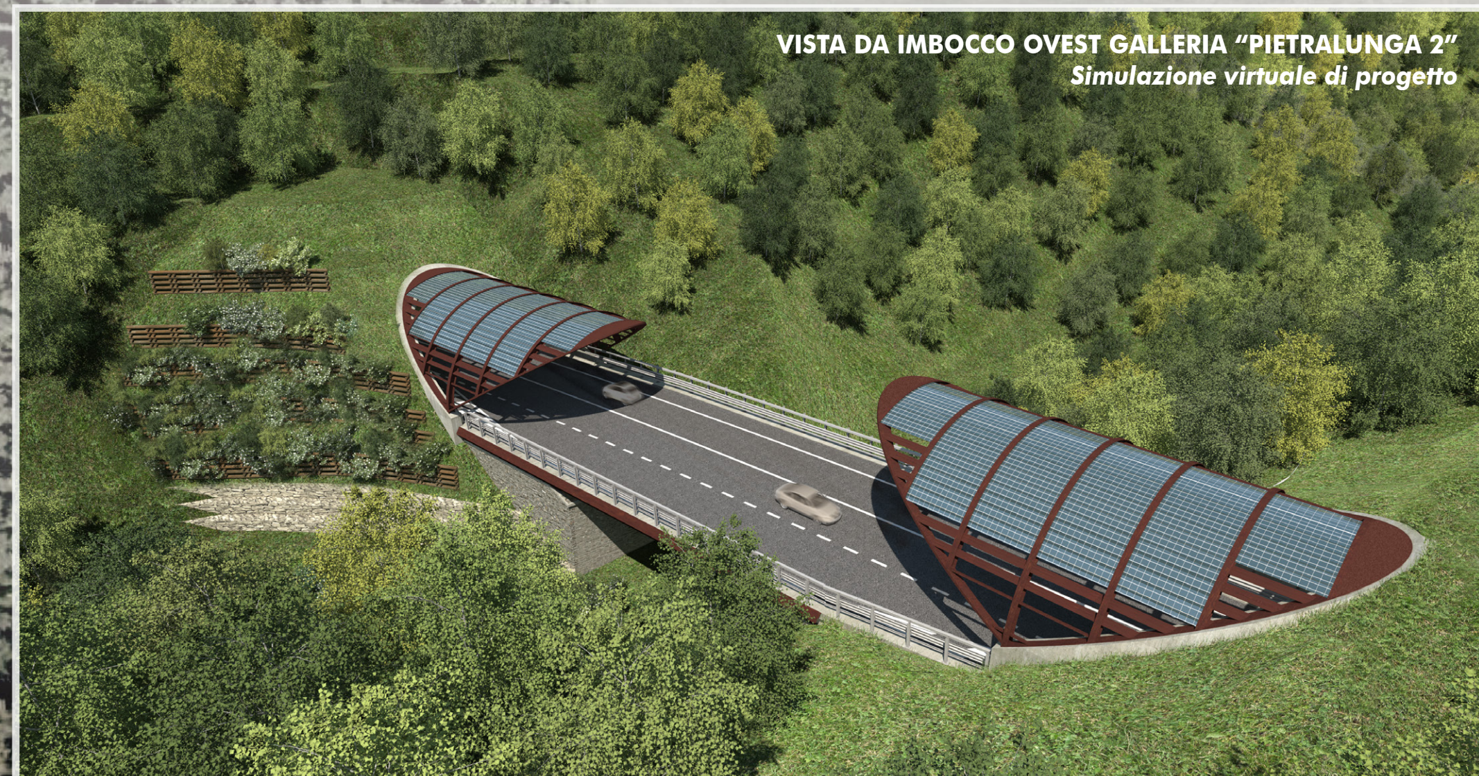
SISTEMA GALLERIA "PIETRALUNGA 1" IMBOCCO EST E GALLERIA "PIETRALUNGA 2" IMBOCCO OVEST