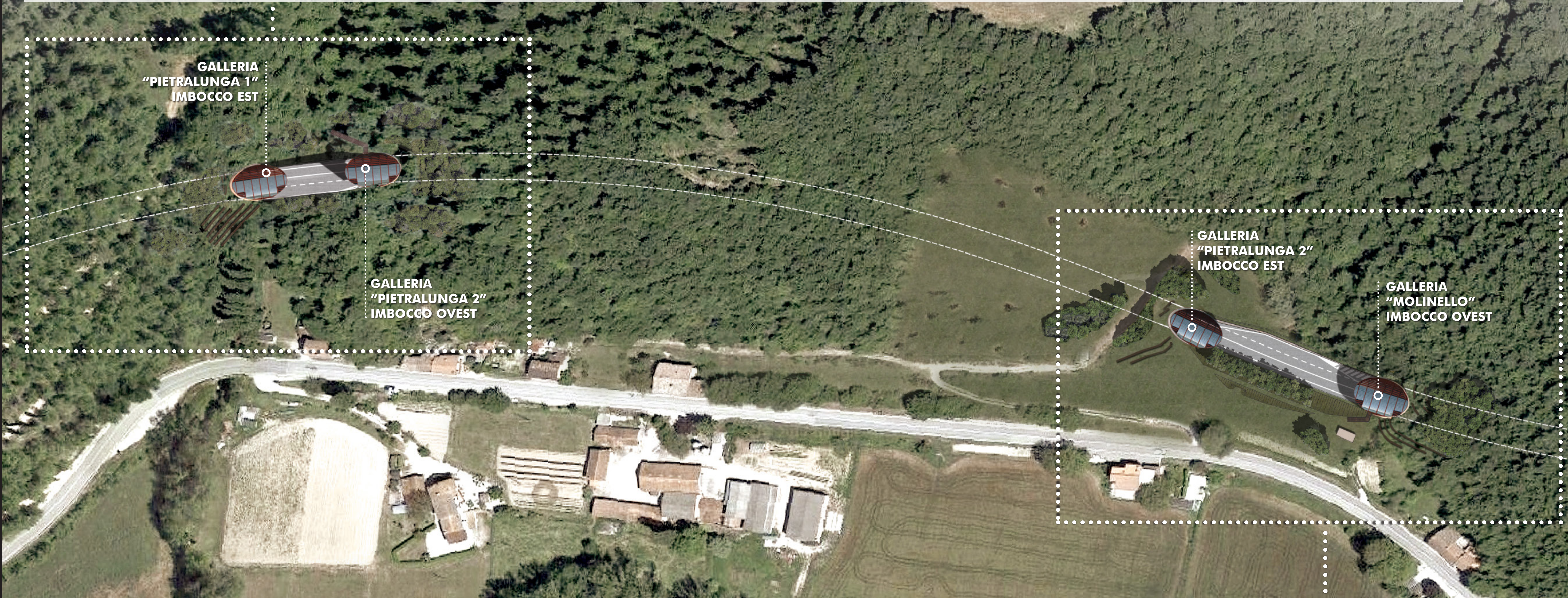
SISTEMA GALLERIA "PIETRALUNGA 2" IMBOCCO EST E "GALLERIA MOLINELLO" IMBOCCO OVEST