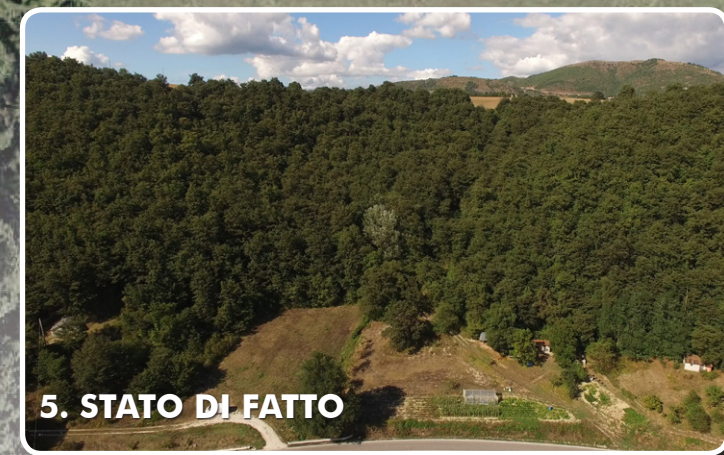
5. STATO DI FATTO