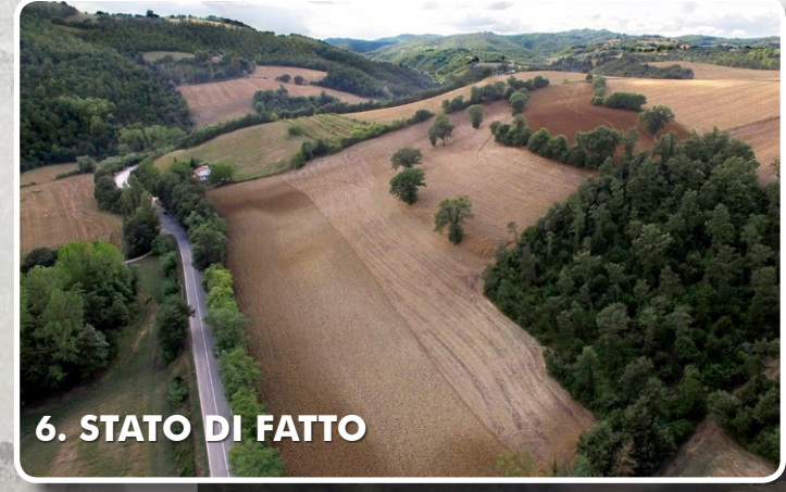
6. STATO DI FATTO