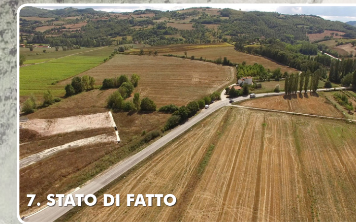
7. STATO DI FATTO