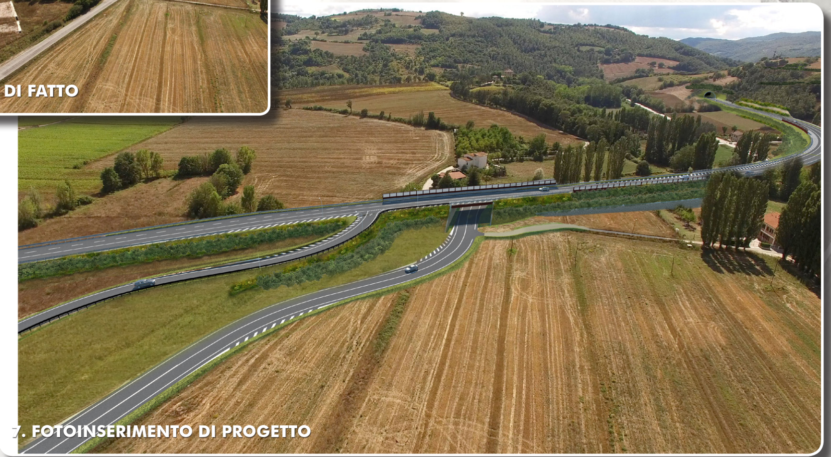
7. FOTOINSERIMENTO DI PROGETTO