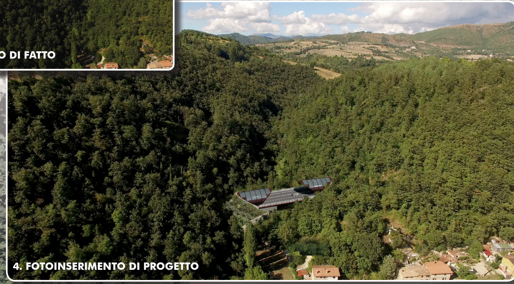
4. FOTOINSERIMENTO DI PROGETTO