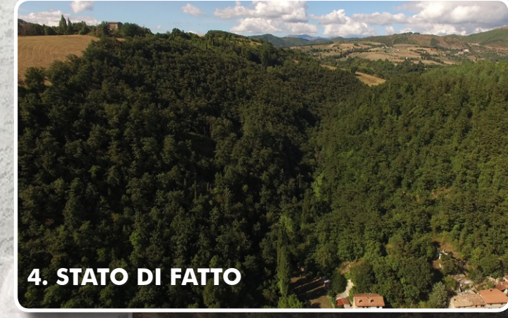
4. STATO DI FATTO