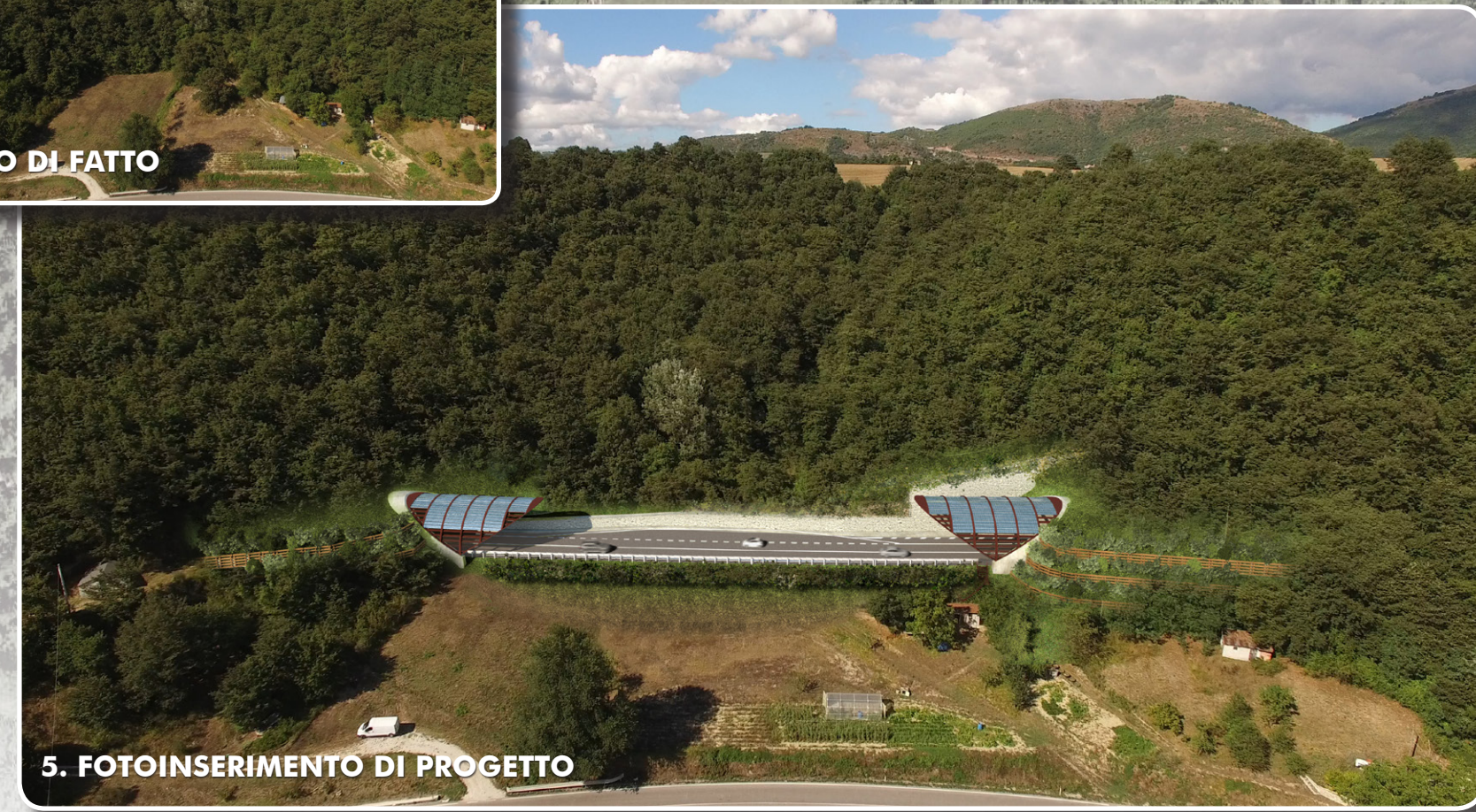
5. FOTOINSERIMENTO DI PROGETTO