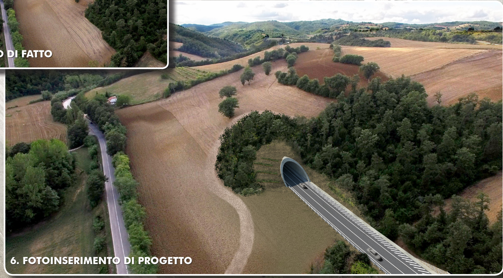
6. FOTOINSERIMENTO DI PROGETTO