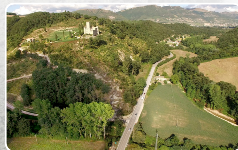
4. FOTOINSERIMENTO DA NORD - OVEST