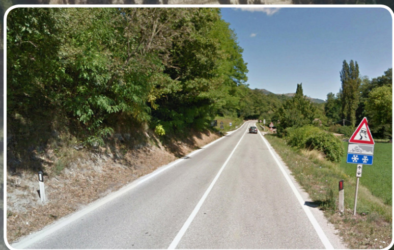
1. FOTOINSERIMENTO DA NORD - OVEST