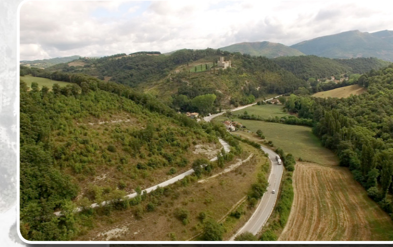
5. FOTOINSERIMENTO DA OVEST