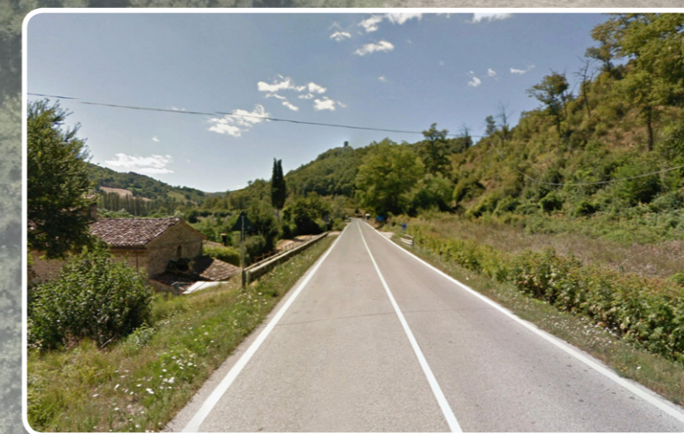
2. FOTOINSERIMENTO DA SUD - EST