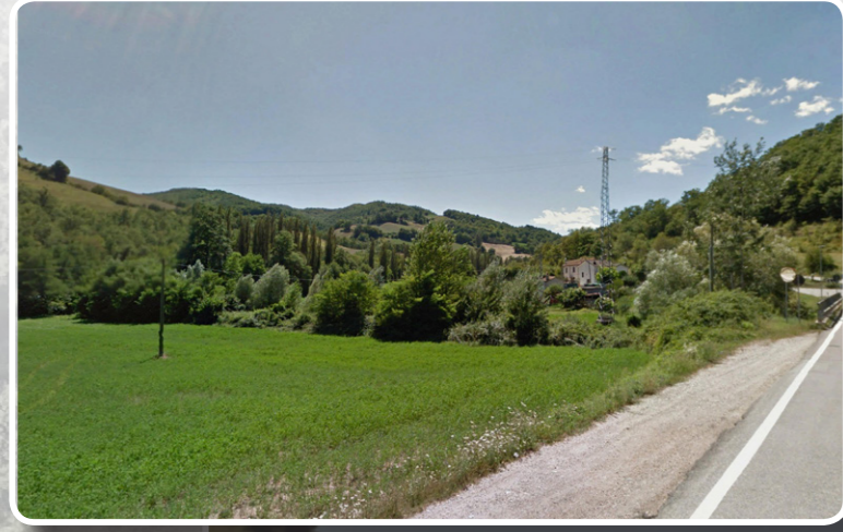
3. FOTOINSERIMENTO DA EST