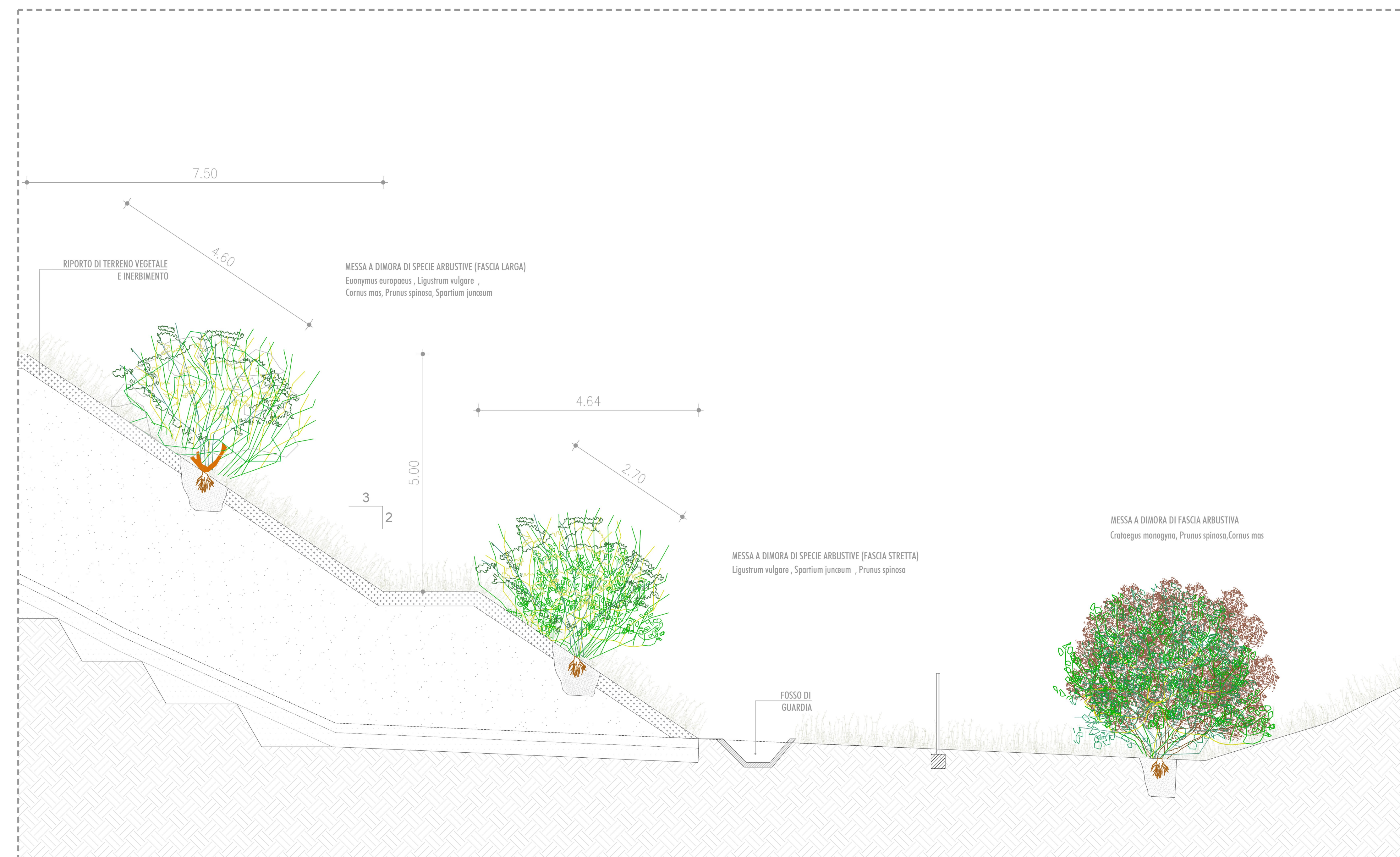
PARTICOLARE B: INTERVENTI DI RICONNESSIONE CON IL PAESAGGIO E GLI ECOSISTEMI MARGINALI ALL'INFRASTRUTTURA SCALA 1:50