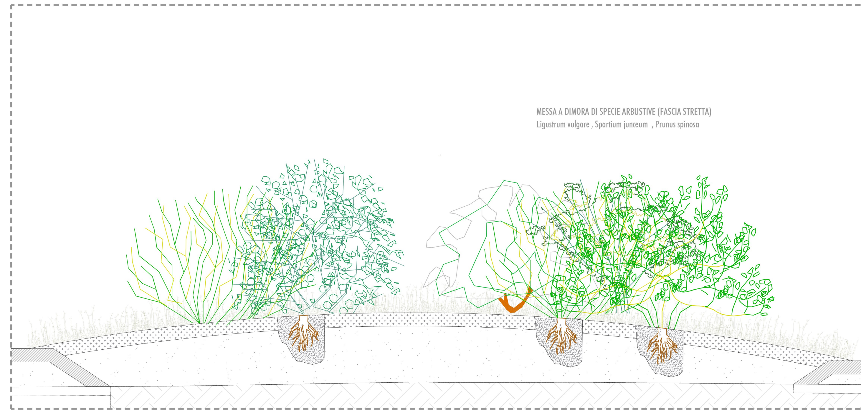
PARTICOLARE A: INTERVENTI DI SISTEMAZIONE NATURALISTICA E PAESAGGISTICA DELLE AREE INTERCLUSE TRA LA VIABILITÀ PRINCIPALE E QUELLA SECONDARIA SCALA 1:50