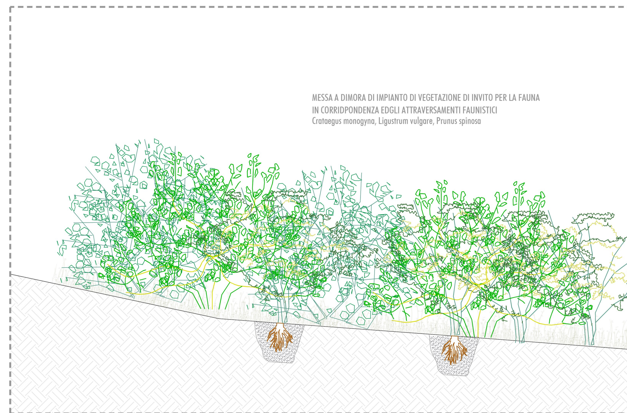
PARTICOLARE A: SISTEMAZIONE A VERDE DELLE SCARPATE AREE DI RICOSTITUZIONE E CREAZIONE DI AMBIENTI DI INTERESSE ECOLOGICO E DI SALVAGUARDIA DEI VALORI ECOSISTEMICI DEL TERRITORIO SCALA 1:50