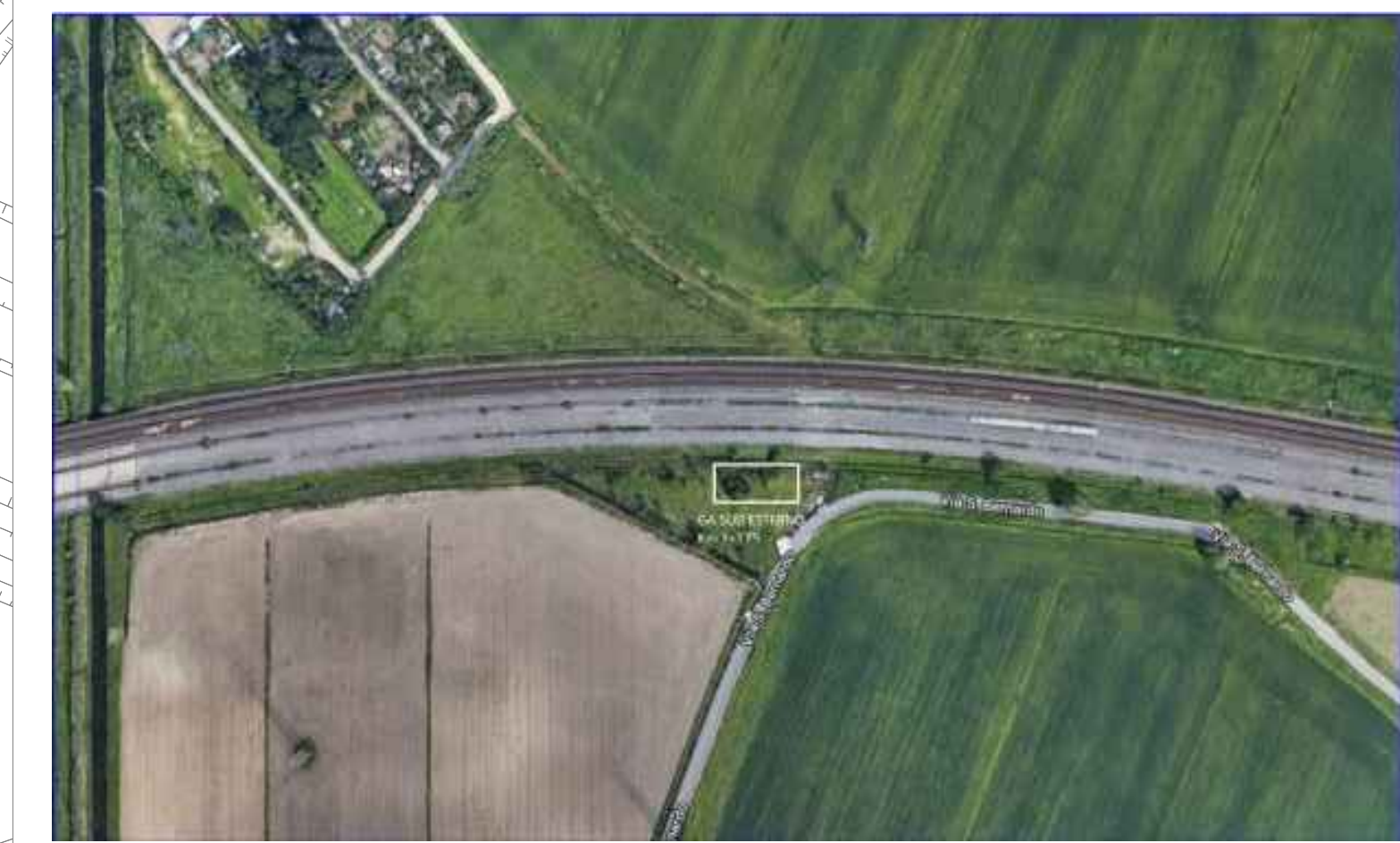
ORTOFOTO - GA SUD