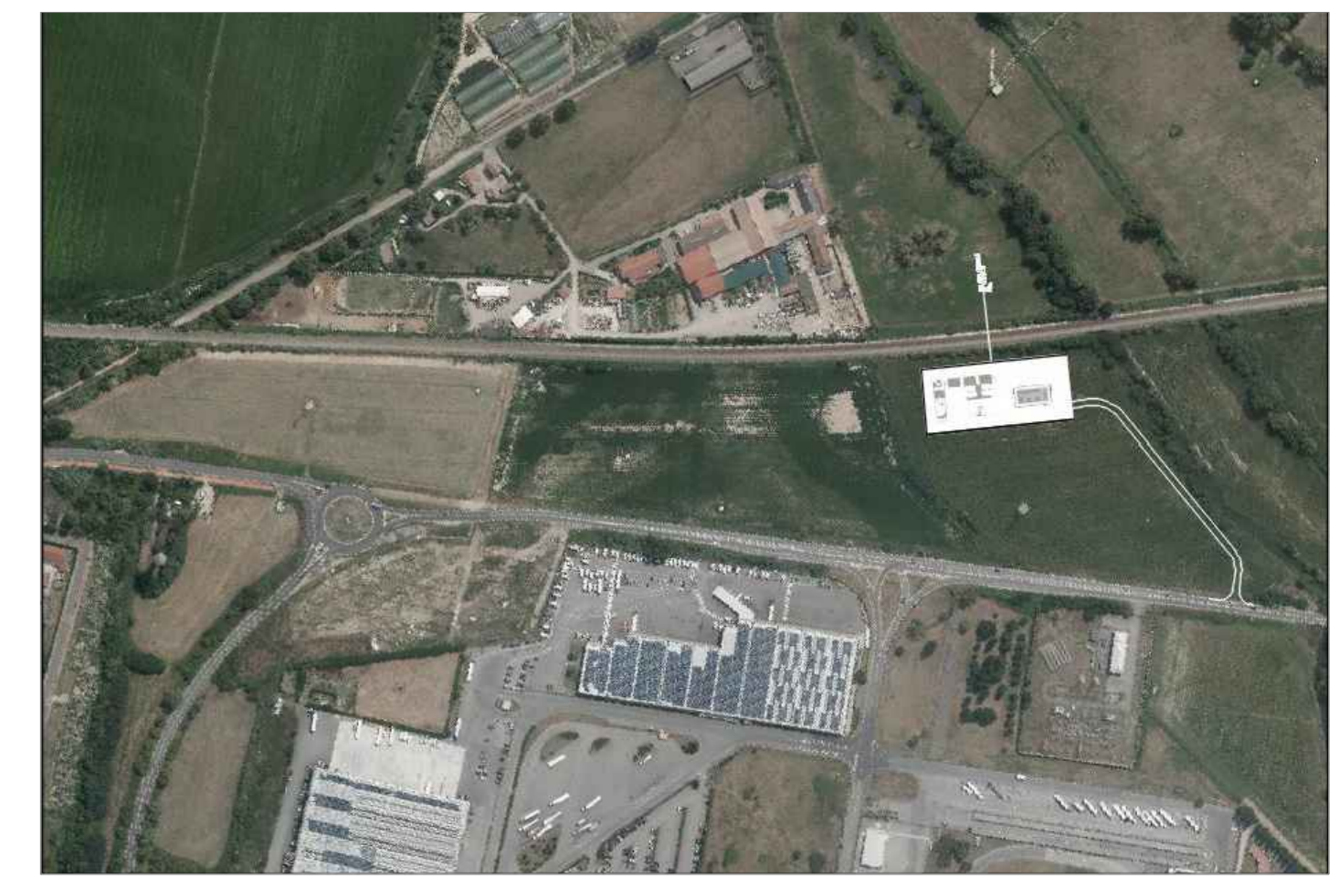
ORTOFOTO - PM TURAGO