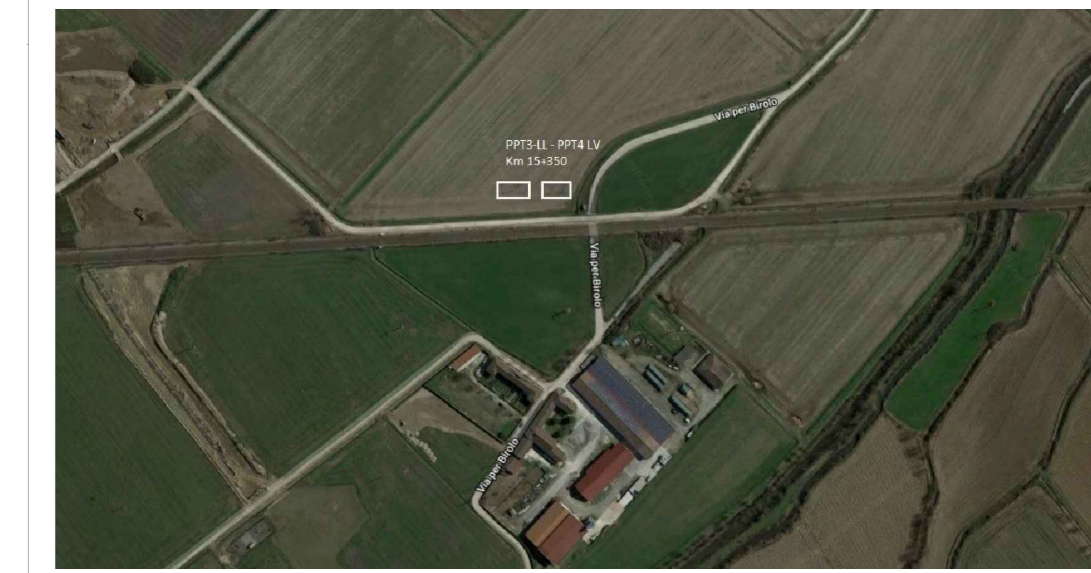
ORTOFOTO - PPT3 PPT4