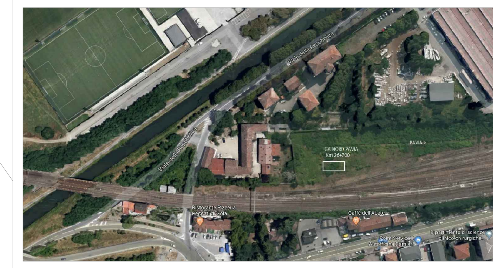
ORTOFOTO - PPT7 PPT8